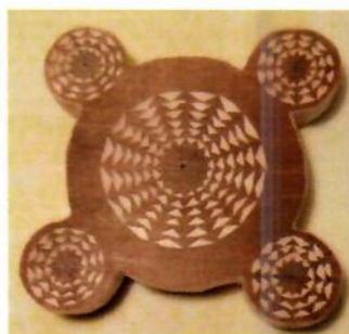
Рис. 2. Образец декоративной подставки