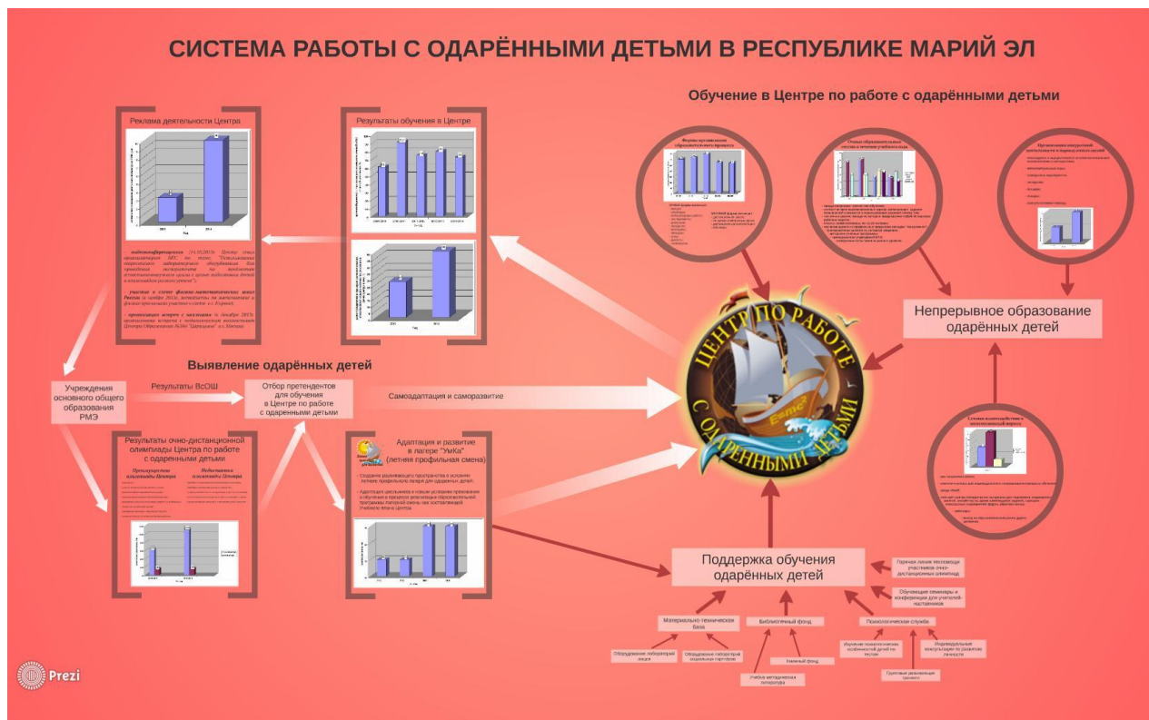
Рис.2. Механизм реализации Программы.

Общее руководство Центром осуществляет руководитель Центра. Методический совет занимается разработкой методологических подходов взаимодействия Центра со всеми субъектами образовательных отношений, организацией методической помощи по выявлению, поддержке и сопровождению интеллектуально одаренных школьников; решением вопросов по планированию и организации деятельности Центра.