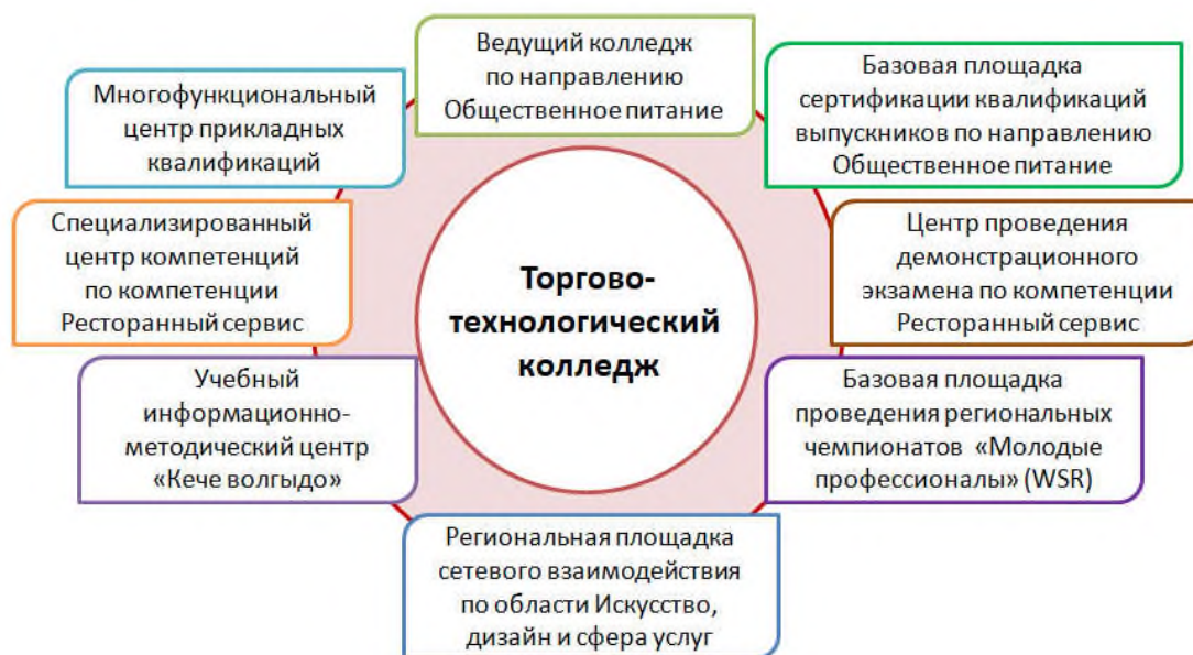
Рисунок 1. Инфраструктура колледжа

Торгово-технологический колледж – инновационное, многоуровневое, многофункциональное образовательное учреждение среднего профессионального образования Республики Марий Эл.