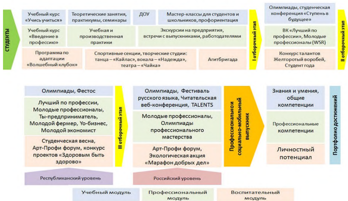
Рисунок 3. Модель модульной практики наставничества обучающихся «Успешный старт в профессию»