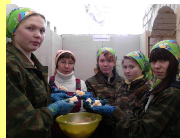
Осваивание жидких обоев