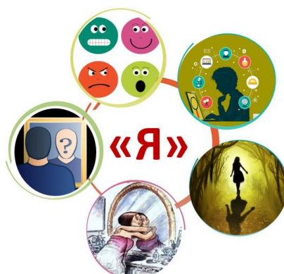
Рисунок 1. – Итоговая схема элементов в создании «образа Я».

Прохождение каждой станции предполагает нахождение участниками составляющих своей личности и расположение их в схеме элементов «образа Я». Каждая станция имеет свое условное обозначение, эмблему и помещается в итоговую схему (см.рис.1).