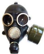
Рис 6.2 противогаз ГП-7

Противогаз ГП-7 (рис. 6.2) представляет собой одну из наиболее совершенных современных моделей. В комплект этого противогаза входят: фильтрующе-поглощающая коробка, лицевая часть шлема-маски, незапотевающие пленки, уплотнительные манжеты (обтюраторы), защитный чехол, сумка.