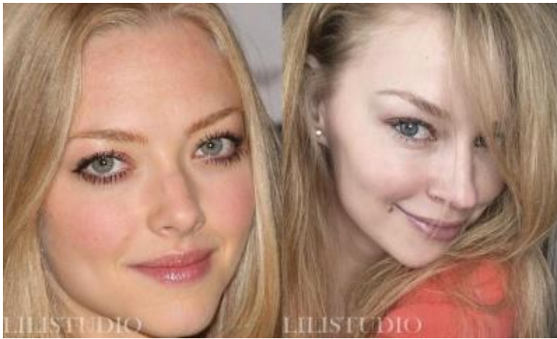
5. Светлая, персиковая теплая или розовая холодная без веснушек. +