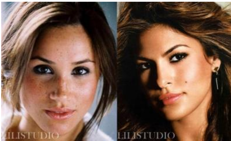
6. Смуглая, желтая с оливковым оттенком +