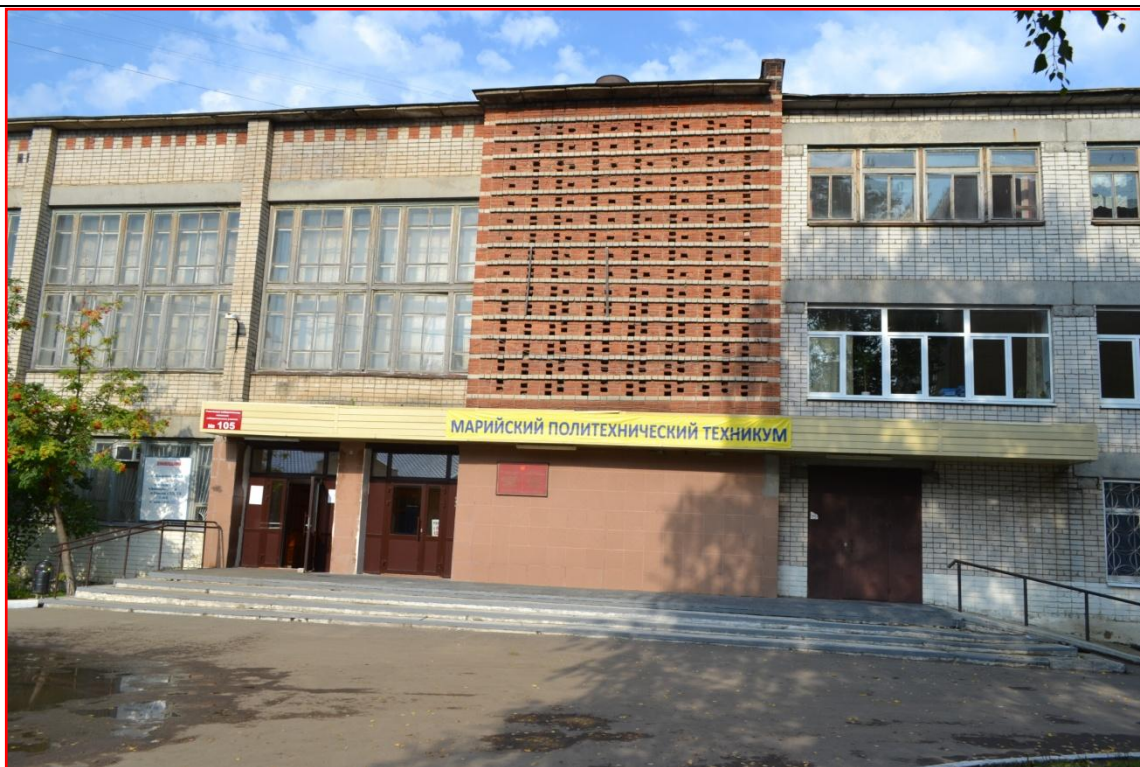
ГБПОУ Республики Марий Эл «Марийский политехнический техникум»