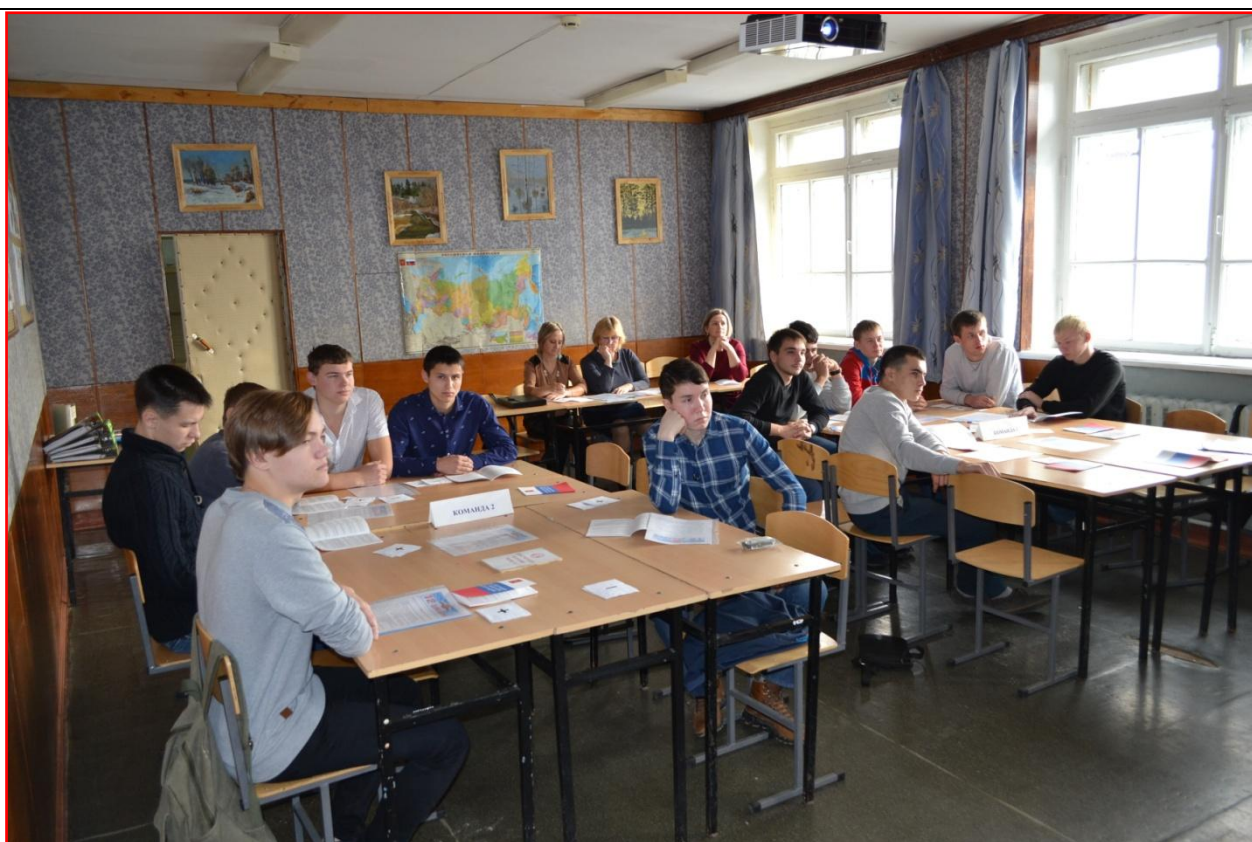
Классный час «12 декабря – День Конституции РФ», группа №31 профессия «Мастер общестроительных работ», 2016 г.