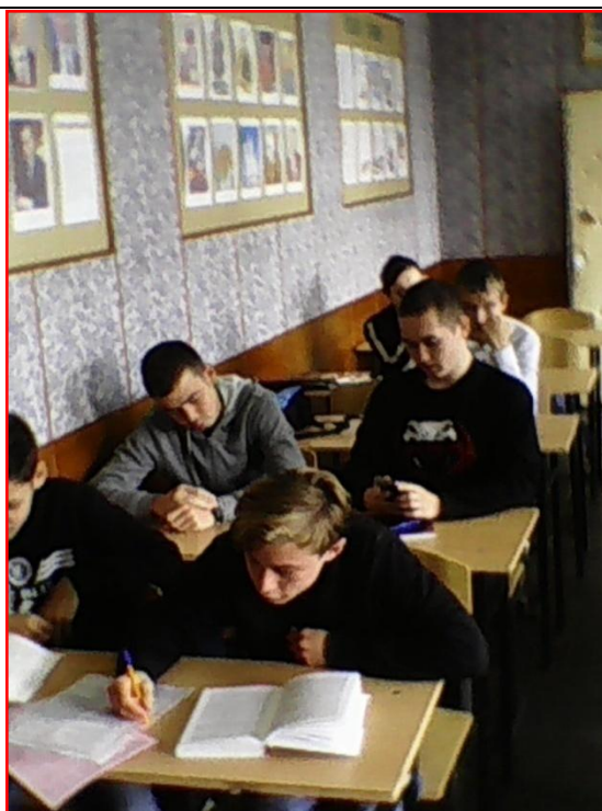
Тестирование по избирательному праву группа ЭО-1 специальность «Монтаж, наладка и эксплуатация электрооборудования промышленных и гражданских зданий», 2018 г.