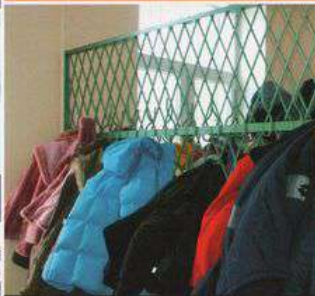
шторы, занавески, одежда