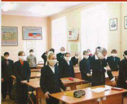
При объявлении пожарной тревоги ученики встают у своих парт и по указанию учителя выходят из класса по одному