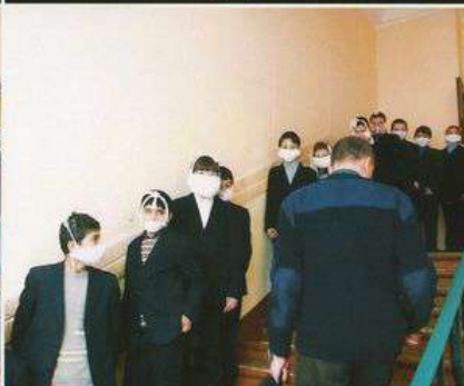
По лестнице ученики определенного класса идут по одному и только с левой или правой стороны, оставляя место для эвакуации другого класса или для подъема пожарных