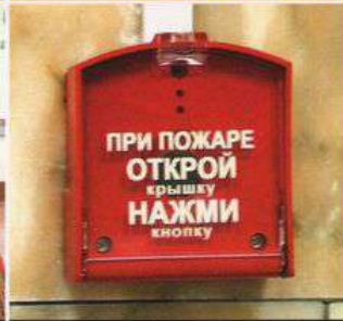
отсутствует или неисправна пожарная сигнализация, не хватает средств пожаротушения