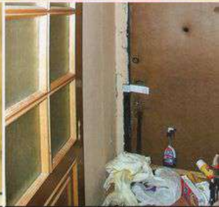
отсутствуют запасные выходы или они захламлены