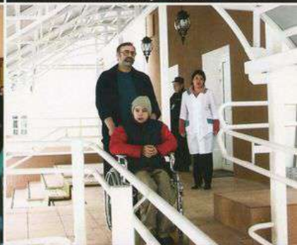
Для детей-инвалидов и учащихся с неуравновешенной психикой в специальных учебных заведениях предусматриваются особые способы эвакуации