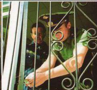
невозможно экстренно открыть решетки на окнах