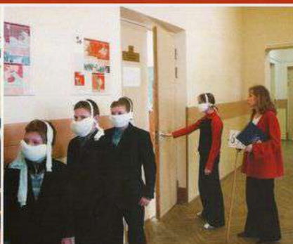
Последний эвакуируемый под контролем учителя плотно закрывает дверь