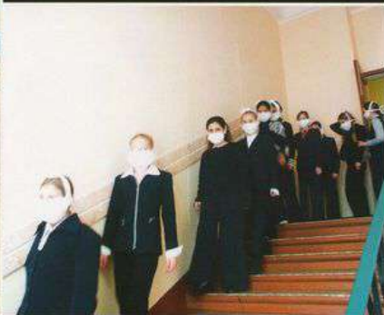
При следовании по коридорам и лестничным клеткам нельзя бежать, обгоняя друг друга