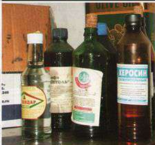
пожаро- и взрывоопасные вещества