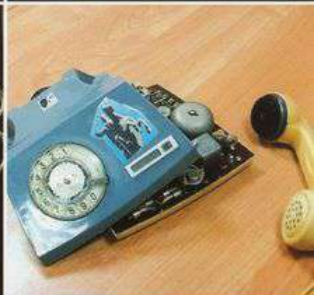
несвоевременно вызваны пожарные