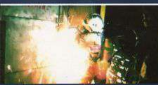
сварочные работы, окурки

Беда приходит при наличии источника огня и топлива для него способствует пожару беспечность