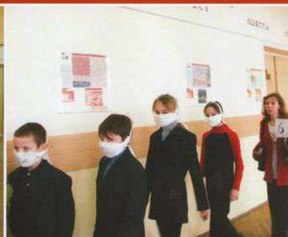
Ученики каждого класса идут в одном строю ровным шагом, не суетясь. Учитель с классным журналом следует последним за своими учащимися