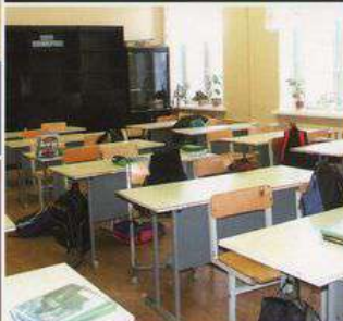
мебель, пластиковая облицовка