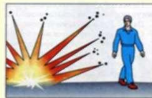
Опасная поза при взрыве