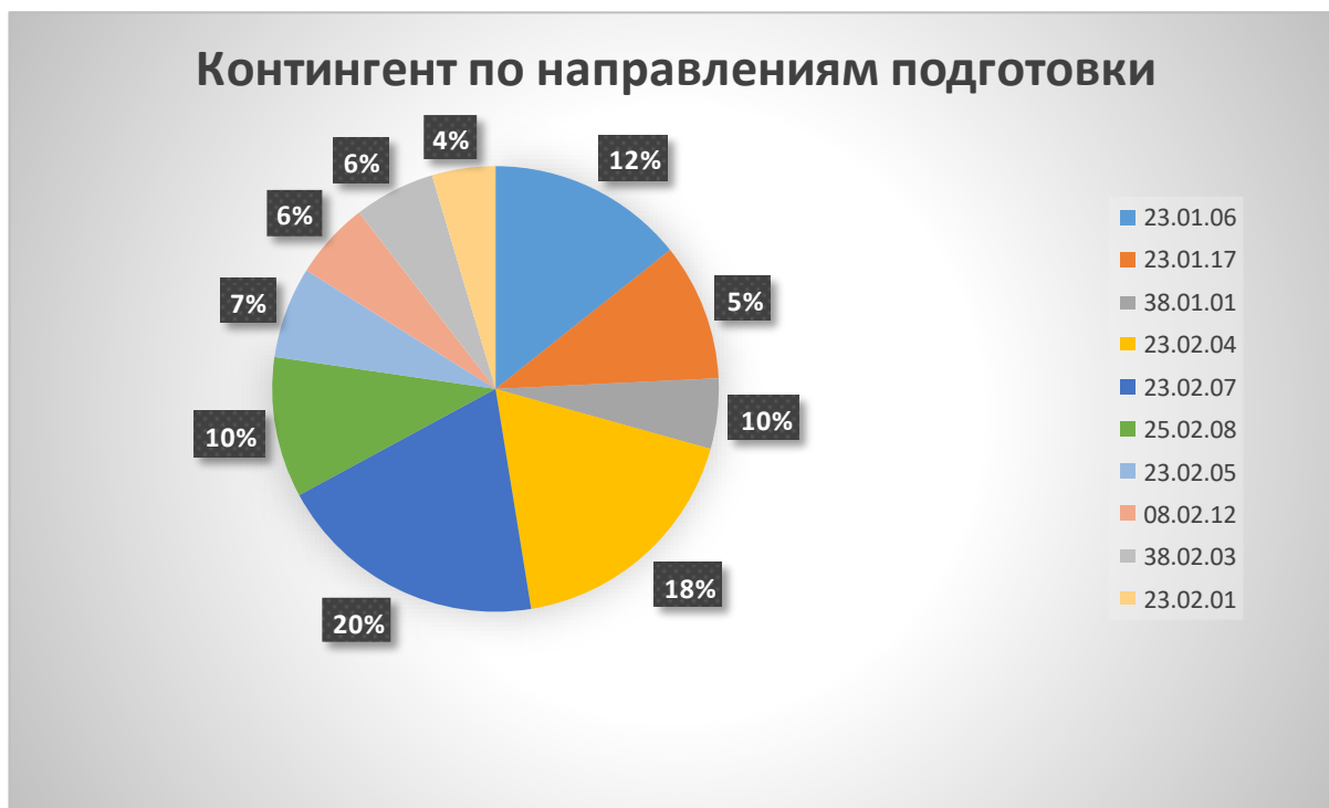
Схема 2 - Структура контингента представлена в диаграмме

В техникуме проводится активная работа по сохранности контингента через различные формы профилактической работы по предупреждению неуспеваемости, содействию в адаптации первокурсников к особенностям образовательного процесса в техникуме, высокому уровню требований к результатам учебной деятельности. Активную работу по сохранности контингента ведет психологическая служба техникума, педагогические работники техникума, кураторы групп. Но несмотря на проделанную работу все-таки существует отсев обучающихся.