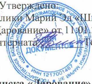
ГРАФИК ОЦЕНОЧНЫХ ПРОЦЕДУР ГБОУ Республики Марий Эл «Школа-интернат г. Козьмодемьянска «Дарование» на II полугодие 2022/2023 учебного года