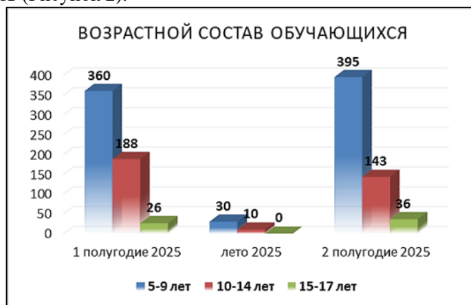
Рисунок 2. Возрастной состав обучающихся ГБОУ ДО Республики Марий Эл «ДЭБЦ»

Анализируя возрастной состав обучающихся за 2024 год, мы наблюдаем небольшой охват обучающихся в возрасте 15-18 лет, педагогами ведется по привлечению обучающихся в волонтерскую деятельность (Рисунок 2):