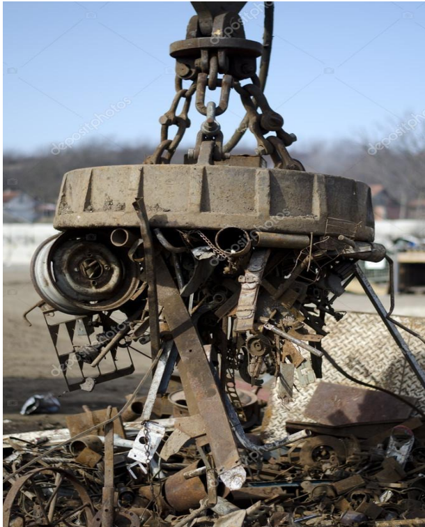
На свалке мусора