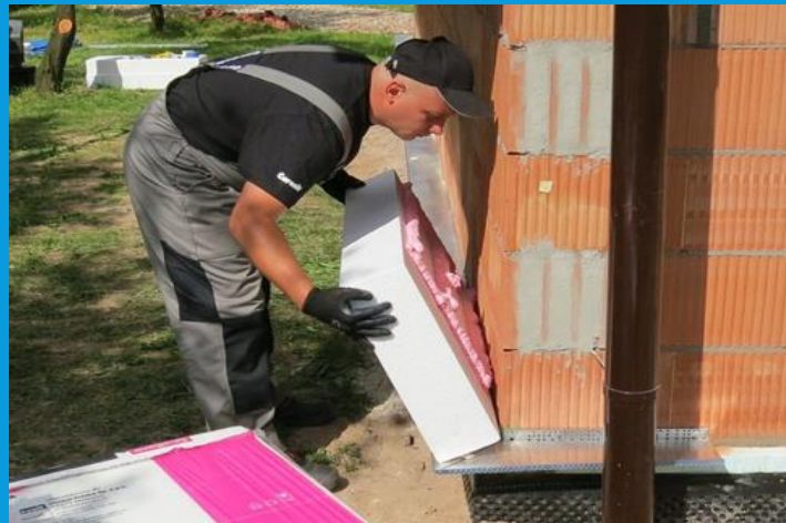
УТЕПЛЕНИЕ ПЕНОПЛАСТОМ ОТ ХОЛОДА СТЕН