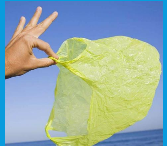
ТАК КАК ПАКЕТ ЛЁГКИЙ, ОН БЫСТРО ВЗЛЕТАЕТ