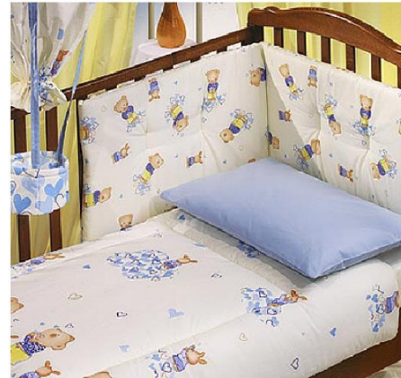
Одеяло, под которым ты спишь, пододеяльник, простыня, наволочка.

Вот как много необходимых в жизни вещей сделано из тканей!