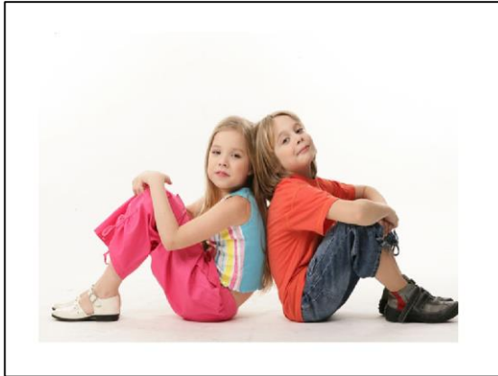
Одежда, в которой ты сейчас, – это два!