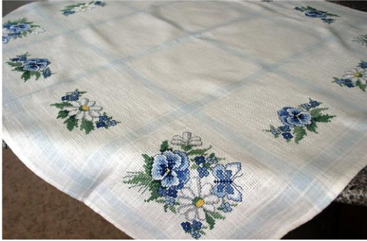
Скатерть на столе – это раз!

Пробовал ли ты посчитать, сколько предметов домашнего обихода сделано из тканей? Давай попробуем, загибай пальчики!