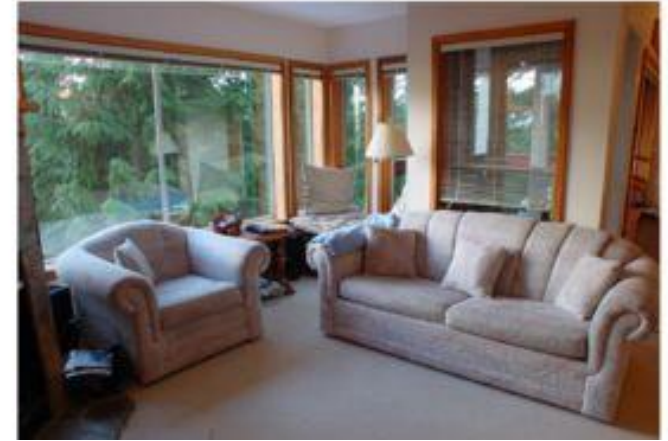
Мягкая мебель – диваны, кресла, стулья – обиты тканью