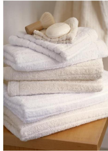
Полотенца в ванной комнате