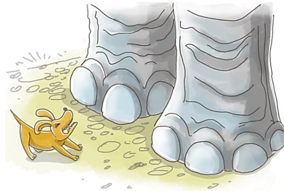
«Слон и Моська»