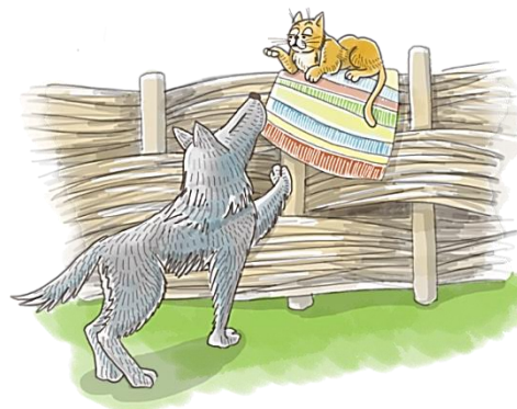
«Волк и Кот»