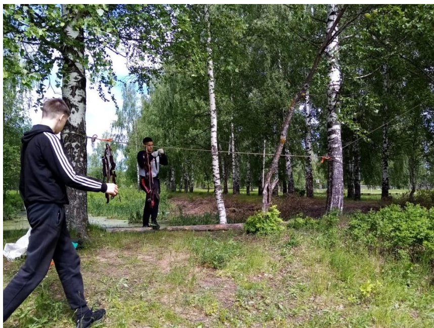
«Тарзанка» - спуск на петеле по натянутой между опорами веревке со страховкой репшнуром.