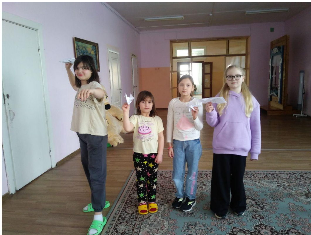
Отправили в полет «Самолеты»