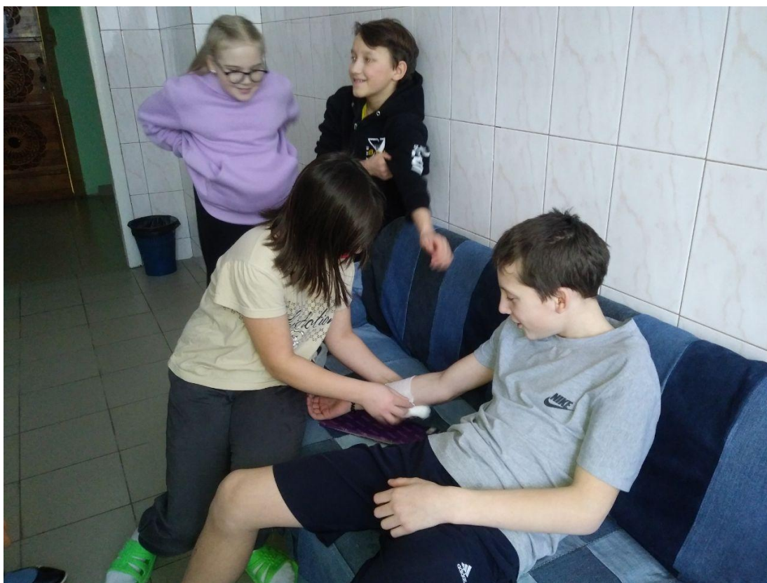
Поработали «Военными медсестрами»