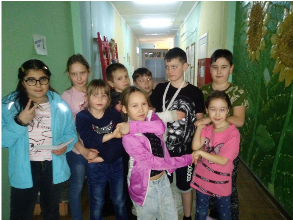
Распутали «Морской узел»