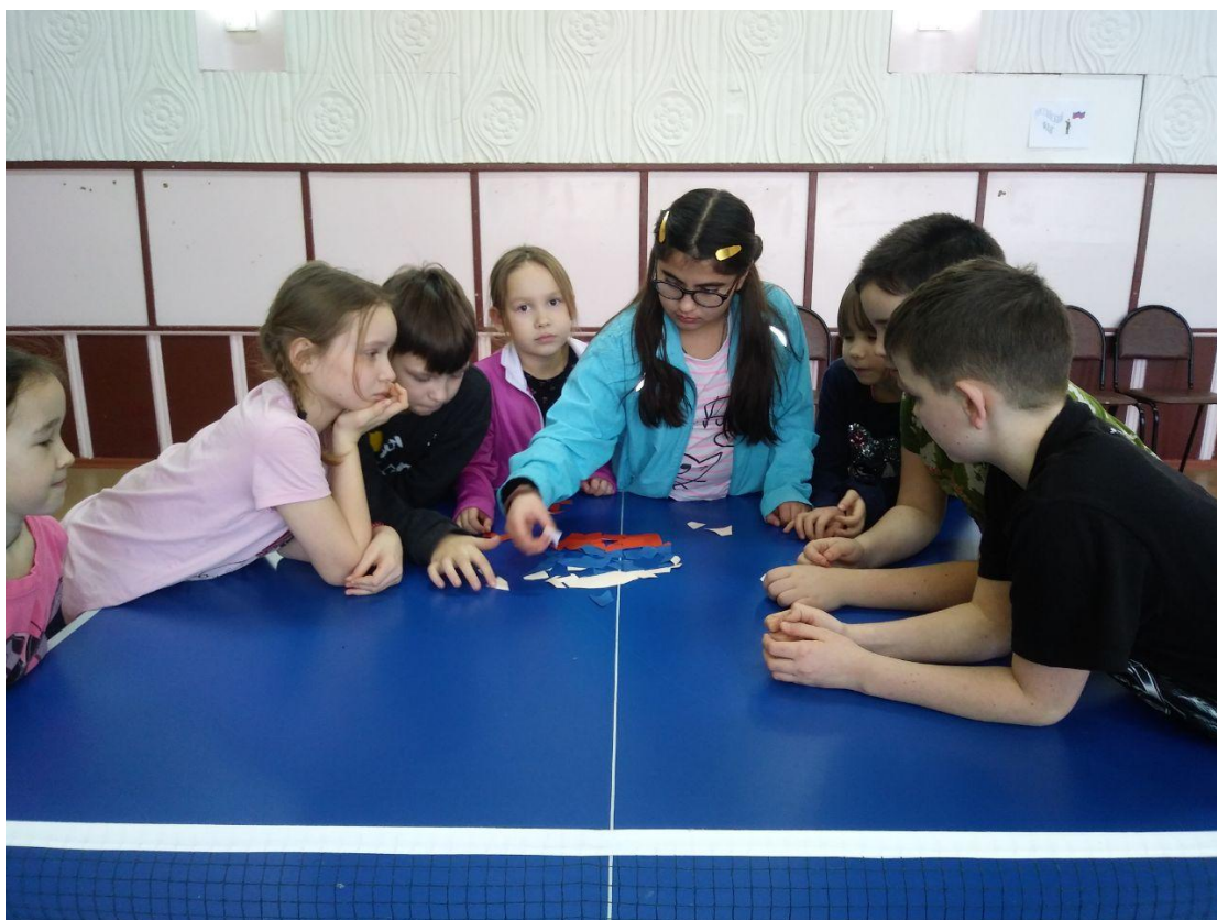
Собрали «Флаг России»