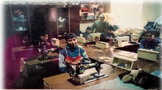
То шьём, то порем