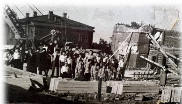
НА МЕСТЕ ЭТИХ РАЗВАЛИН ПОСТРОЕНЫ МАСТЕРСКИЕ