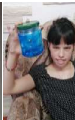
Задание в 9 классе по теме: «Первоцветы» и «Дорожные знаки». Поделка «Космос в банке»