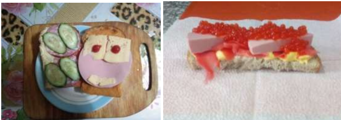
Приготовление бутерброда на уроке СБО дистанционно