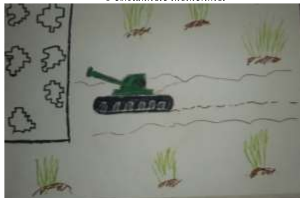
Рисунки по темам: «День космонавтики» и «День Победы».