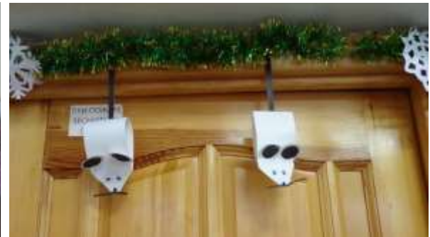
Мышата тоже главные герои Нового 2020 года.