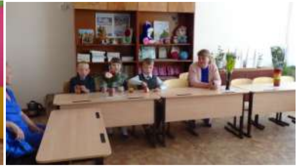
2 а класс