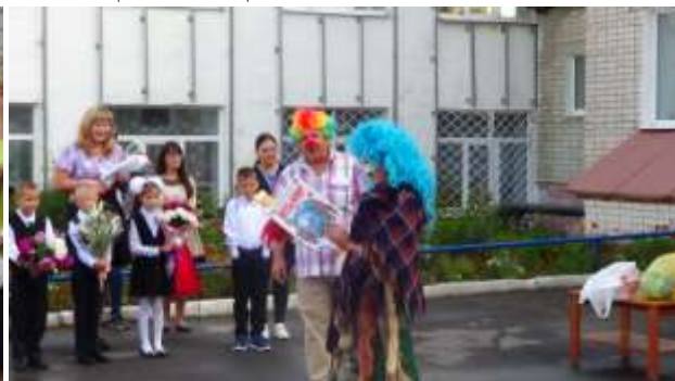
На линейку пришли гости - Клоун и Кикимора.