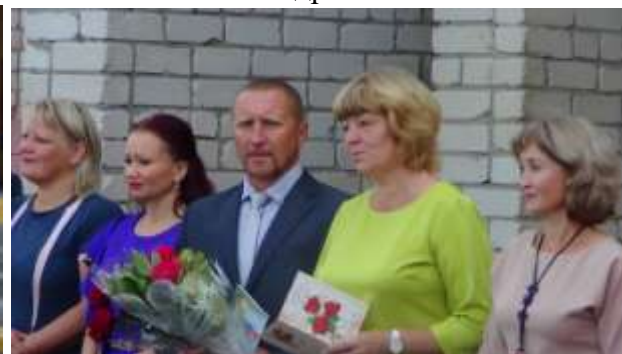
Администрация школы и гости