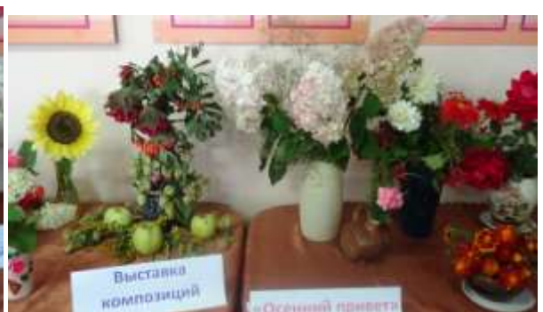
Воспитатели с нетерпением ждали своих ребят и подготовили для них подарки - осенние композиции.