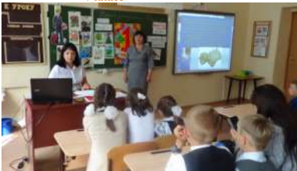
Урок "Россия-родина моя" во 2а и 4 классах