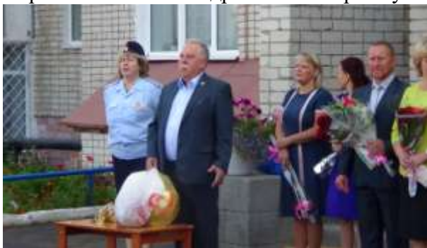
Вручение подарков гостями