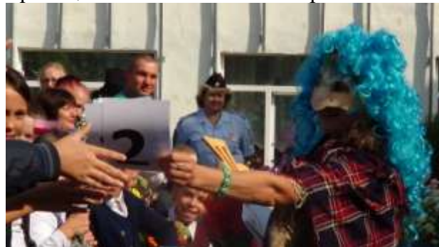
Кикимора раздает двойки

Клоун Кузя принес учащимся ключ от школы. Да оказался этот ключ у Ябеды-корябеды Кикиморы, которая устроила ребятам испытания и отговаривала учиться в школе. Да пошутила Кикимора, вернула ключ детям и пожелала им быть честными, добрыми, дружными и хорошо учиться.