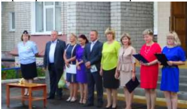
Начало линейки, посвященной Дню Знаний