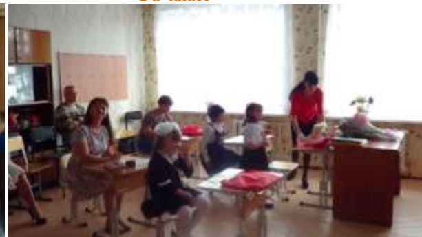
2 б класс