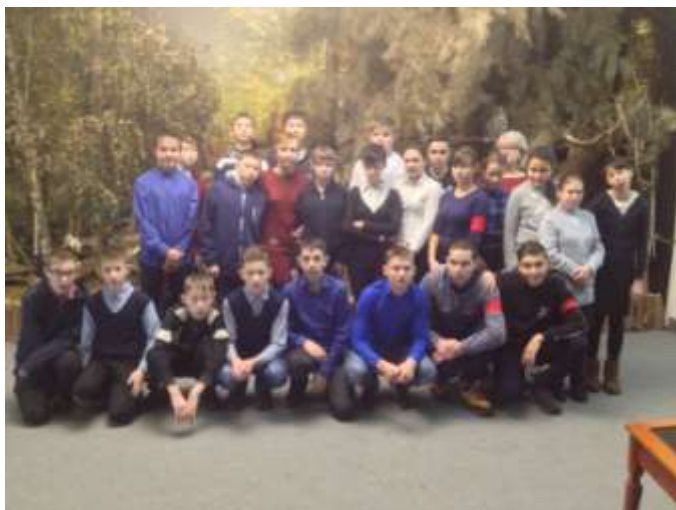
Экскурсия в краеведческий отдел музея