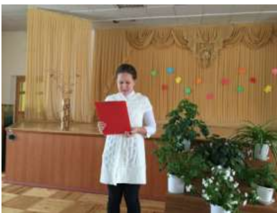
Конкурс чтецов "Люблю тебя, мой край родной!"