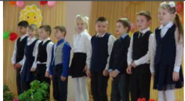
Песню "Мама" исполнили учащиеся 3 класса.

Мама, будь всегда со мною рядом! Мама, мне ведь большего не надо! Мама, только не грусти! Ты меня за все, мамочка, прости! Ты слышишь, мама, будь всегда со мною рядом! Мама, мне ведь большего не надо! Мама, только не грусти! Ты меня за все, мамочка, прости!