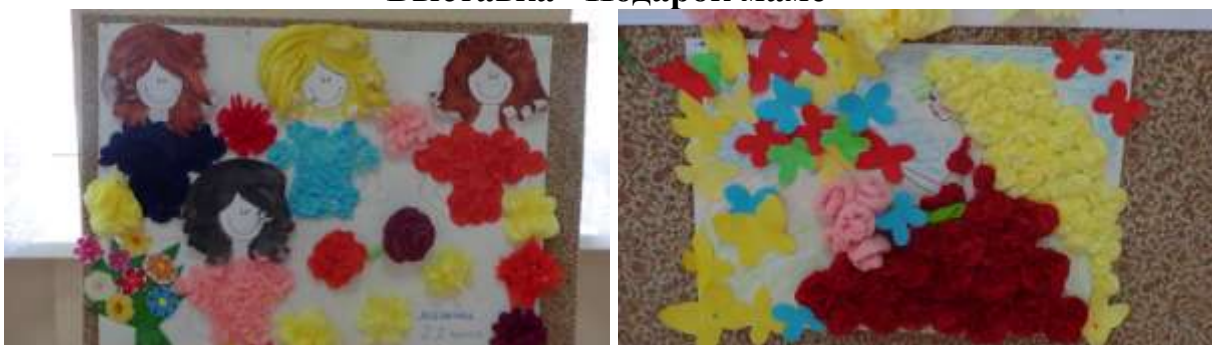
Портреты мамочек 2 б класса