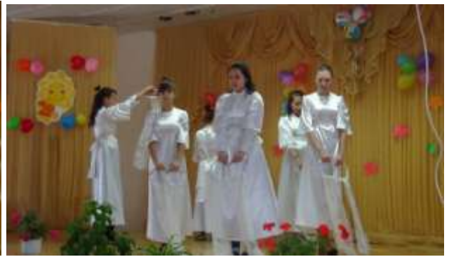
Нежным танцем "Фея" девочки 7,8,9 класса проложили концерт.