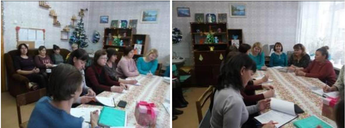
Методическое объединение воспитателей

По теме: "Семья - важнейший институт воспитания детей, находящихся в трудной жизненной ситуации" состоялось методическое объединение воспитателей.