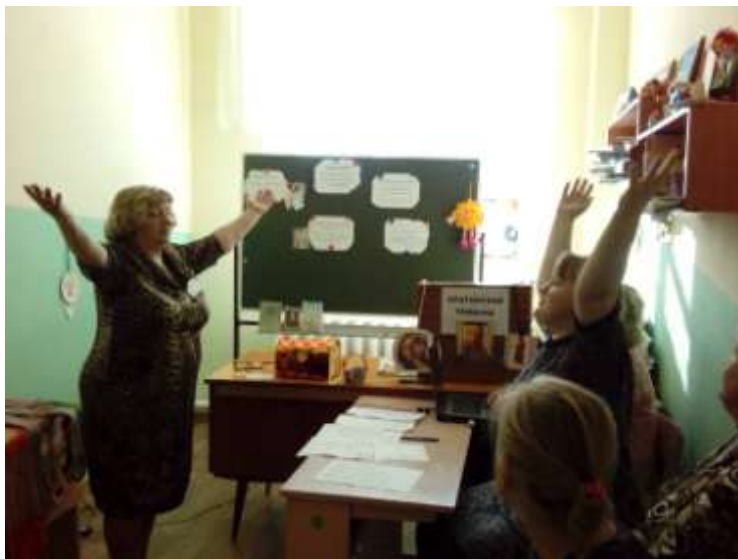
Участие в работе семинара в ДДТ г.Козьмодемьянска