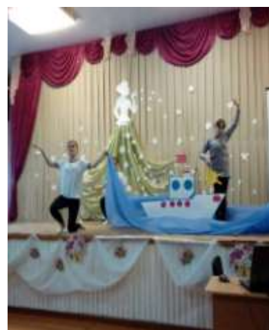
Семинар в Октябрьской школе-интернат для детей сирот и детей, оставшихся без попечения родителей. На концерте

В конце III четверти 26 марта состоялись Методические объединения учителей и воспитателей школы: