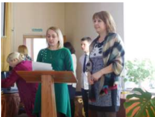
Члены профсоюза вручают грамоты