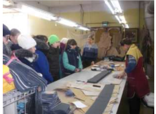
Экскурсия на швейную фабрику