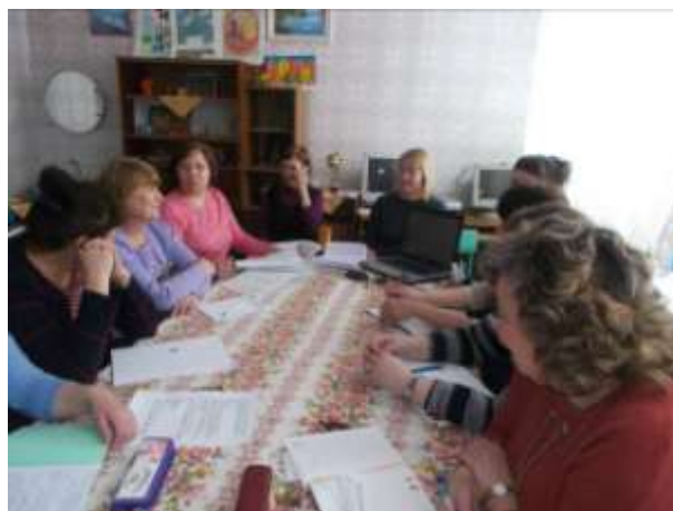
Заседание МО воспитателей

27 марта состоялось заседание педагогического совета школы на тему " Создание воспитательного пространства образовательного учреждения для самореализации и социализации школьников ".