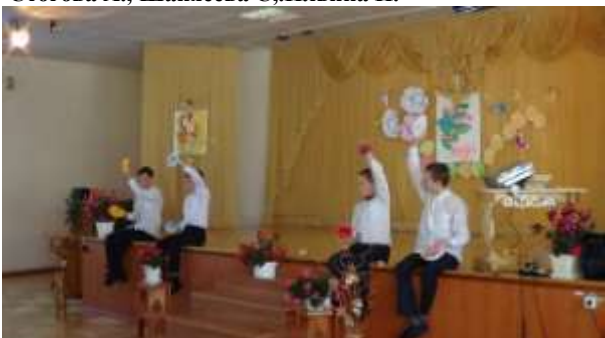
Танец с цветами "Весеннее настроение"