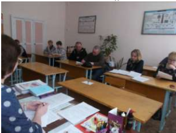
Заседание МО учителей- предметников