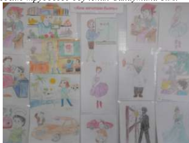
Конкур рисунков "Кем мечтаю стать?"