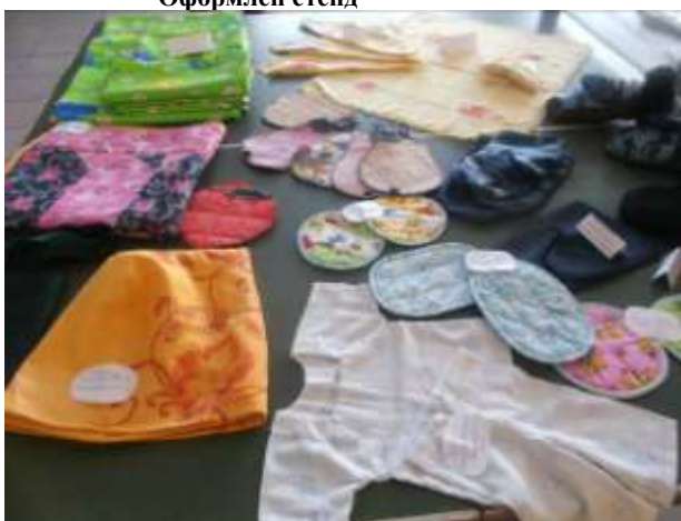
Выставка работ, сделанных руками девочек