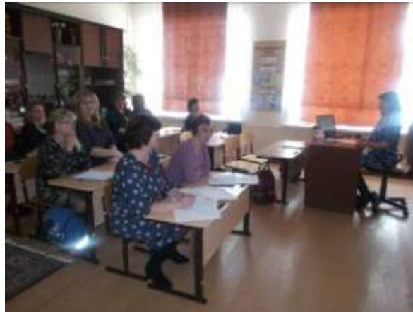
Заседание МО классных руководителей