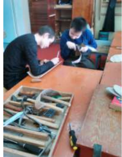
Уроки обувного дела