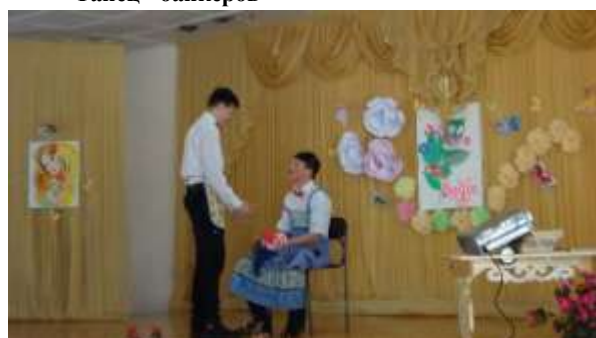
Сценка "Женский день"