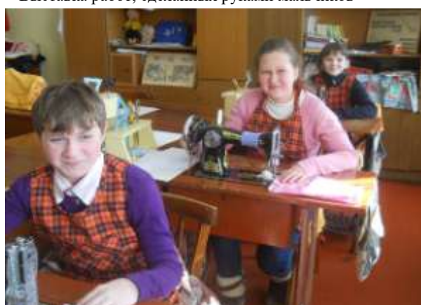
Конкурс "Лучший по профессии"