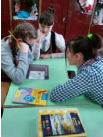
Конкурс "Умники и умницы"