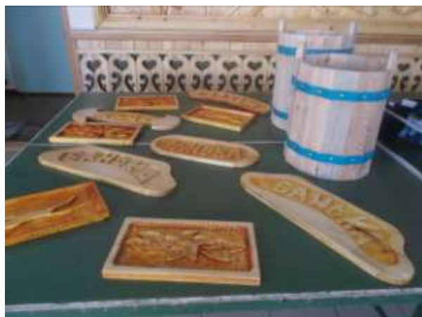
Выставка работ, сделанных руками мальчиков