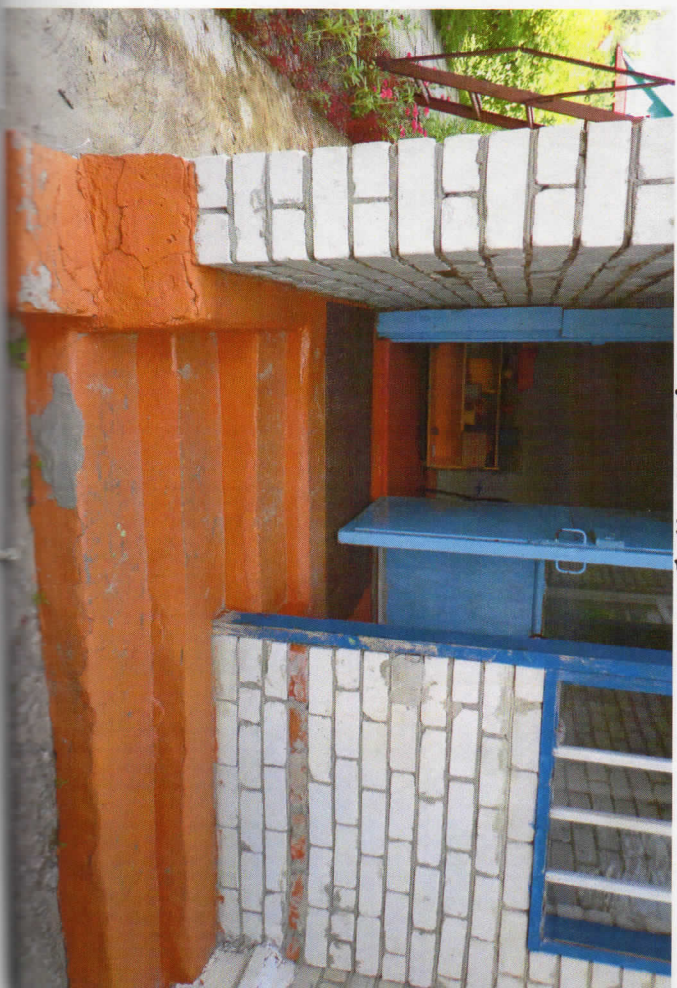
Формо № 31