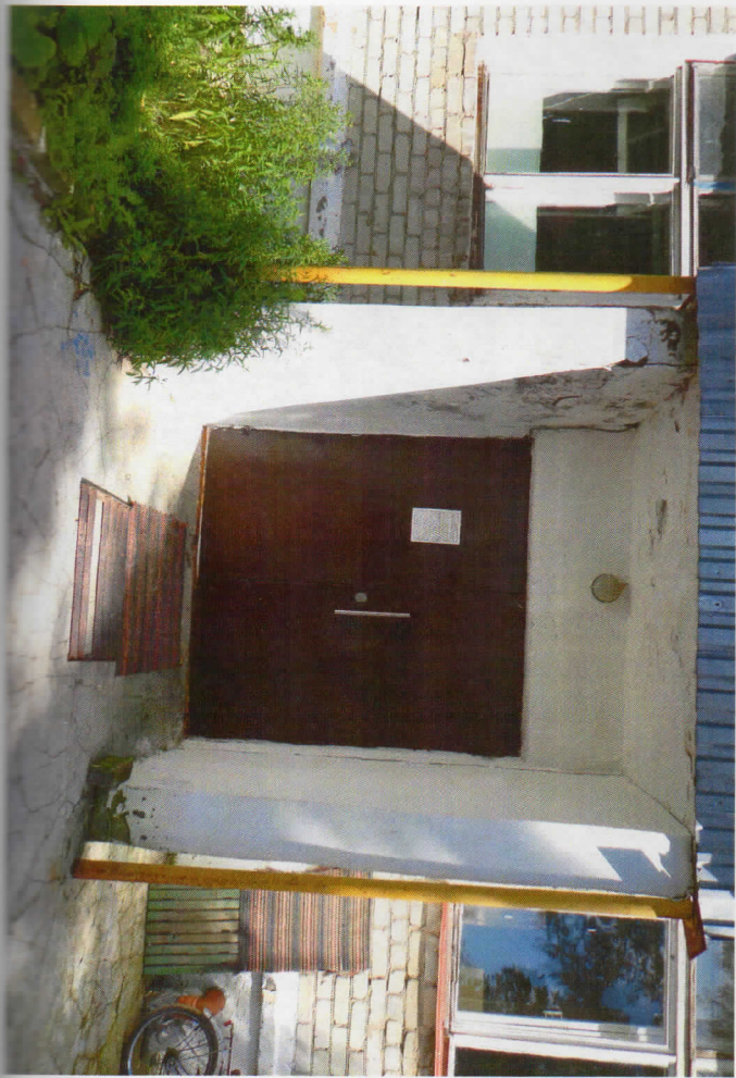
Формо № 29