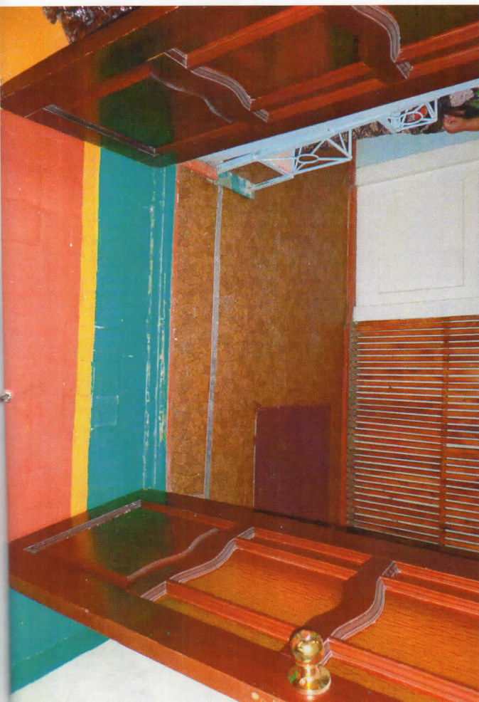
Формо № 54