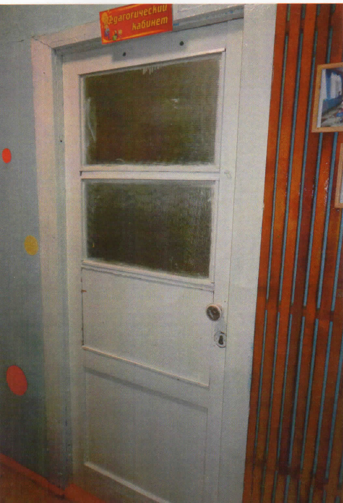
Формо № 36