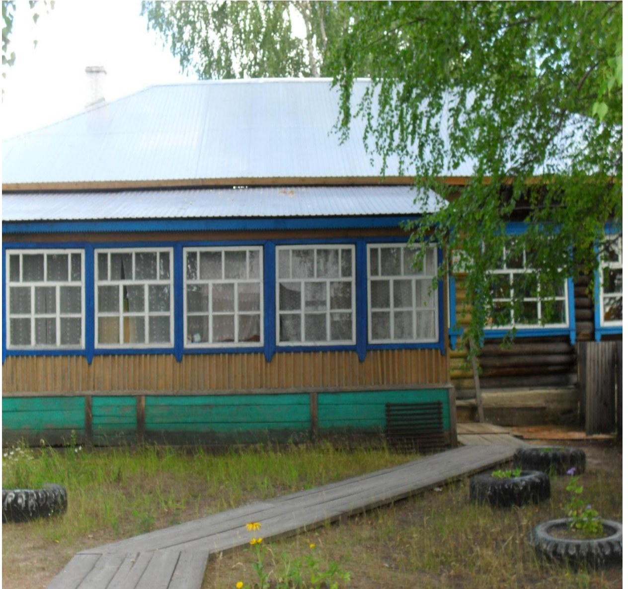
Муниципальное бюджетное дошкольное образовательное учреждение «Детский сад «Земляничка»»