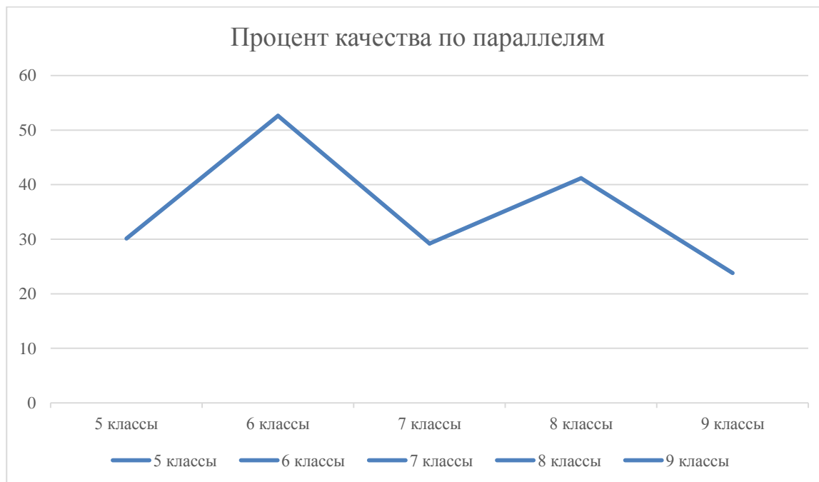
Таблица 8. Результаты освоения учащимися программы основного общего образования по показателю «успеваемость» в 2025 году (на 29.12.2025 )