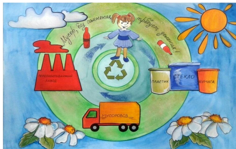
Плакаты – рисунки воспитанников