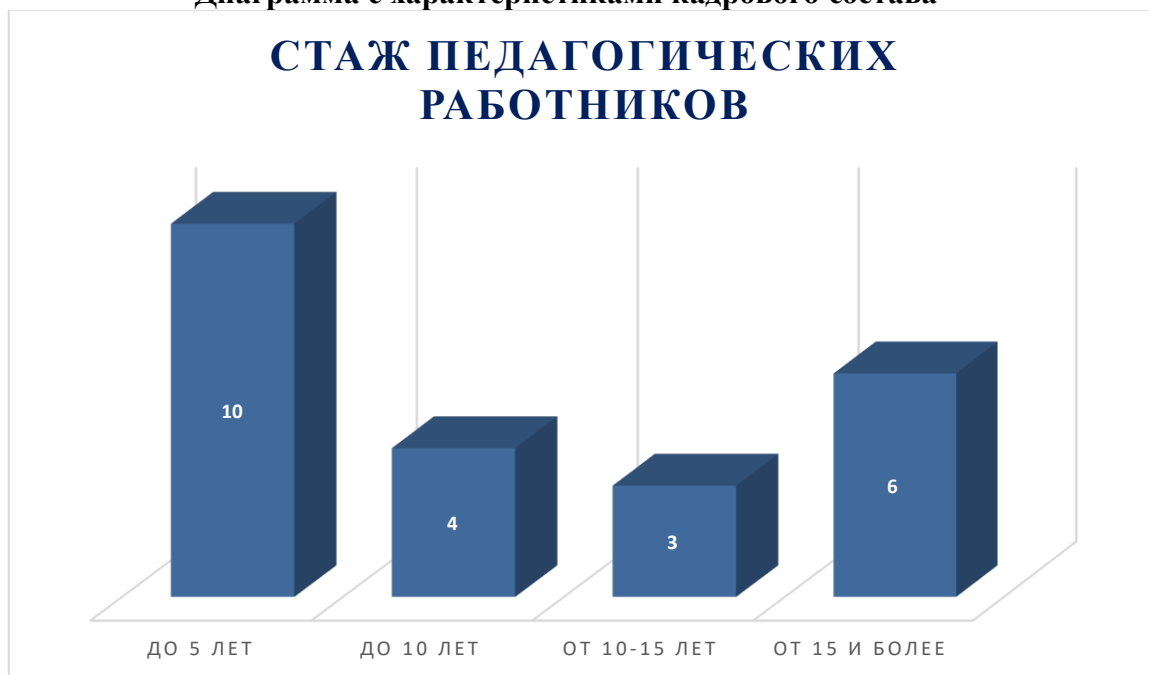
Диаграмма с характеристиками кадрового состава