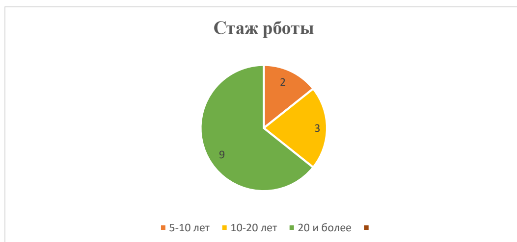
Рис. 1 Стаж работы педагогов