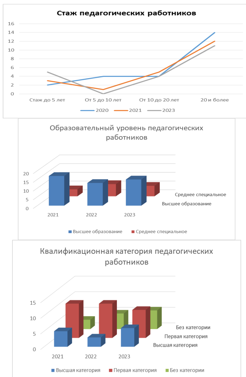
Диаграмма с характеристиками кадрового состава детского сада

Активно принимают участие в работе межрегиональных, республиканских, городских методических семинаров, мастер-классов, конкурсов.