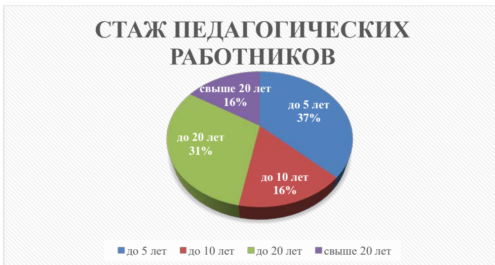
Диаграмма с характеристиками кадрового состава ДОУ