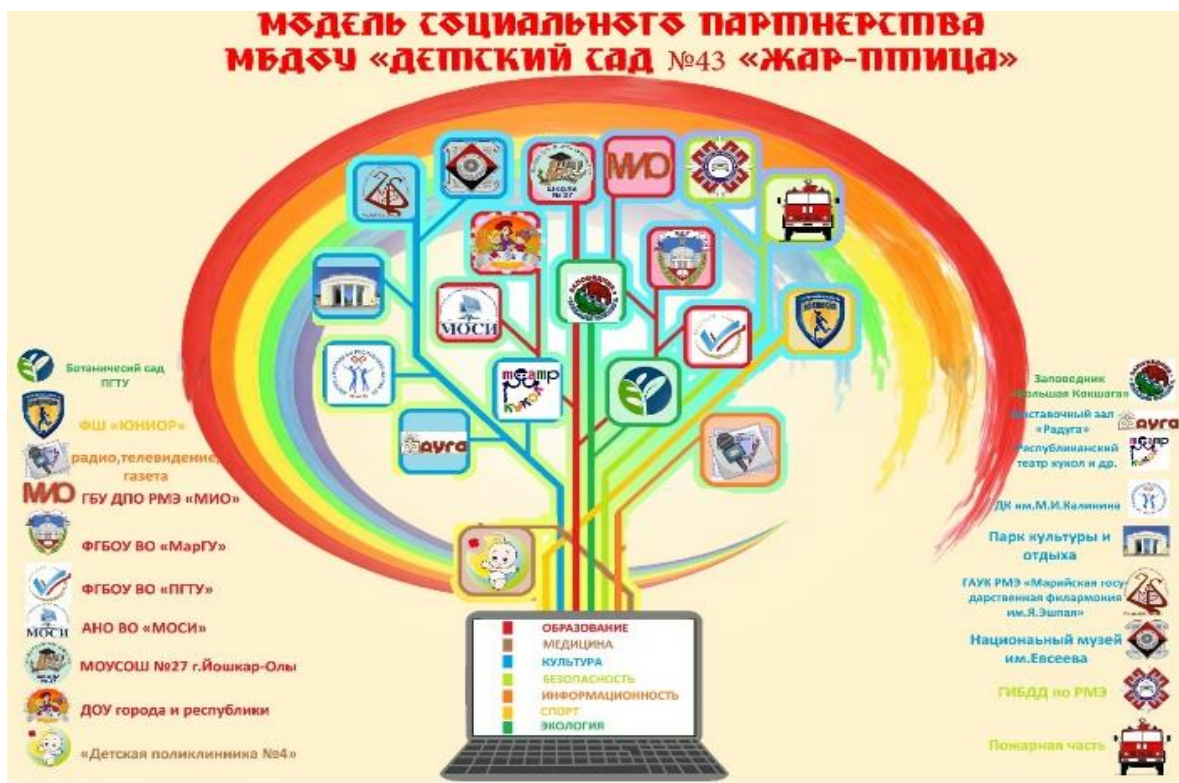
Социальными партнерами ДОУ в 2025 году представлено в таблице:

грамотным, профессиональным безопасным. Модель социального представлен МБДОУ «Детский сад №43 «Жар-птица» представлен в схеме: