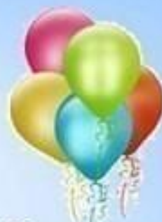
Пять воздушных шаров