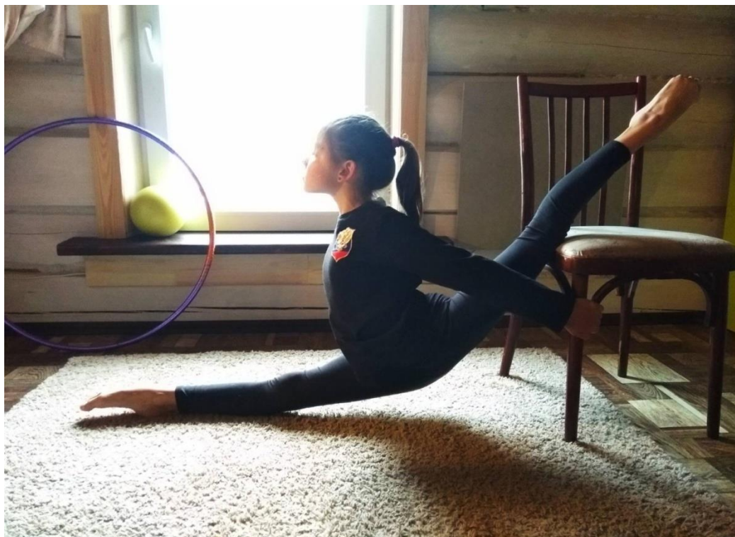
Растяжка с возвышения на заднее бедро