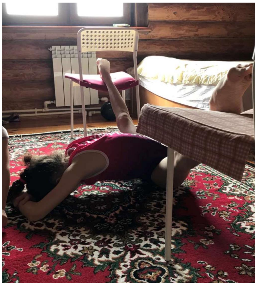
Растяжка в поперечных шпагат с двух опор