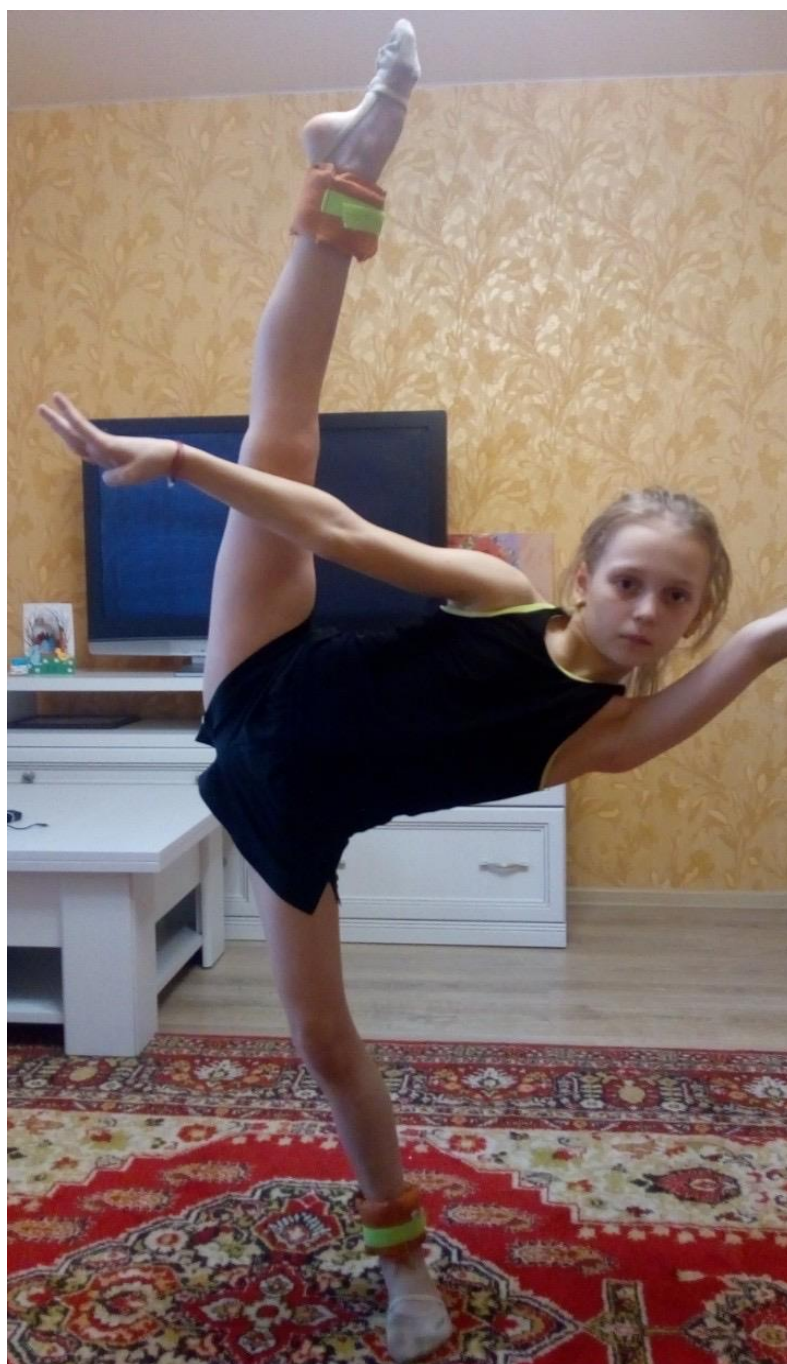
Боковой наклон без помощи руки