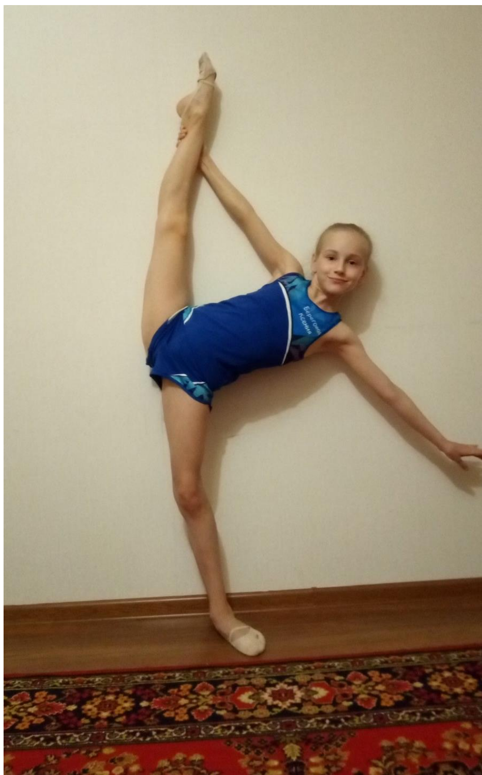
Боковой наклон с помощью руки