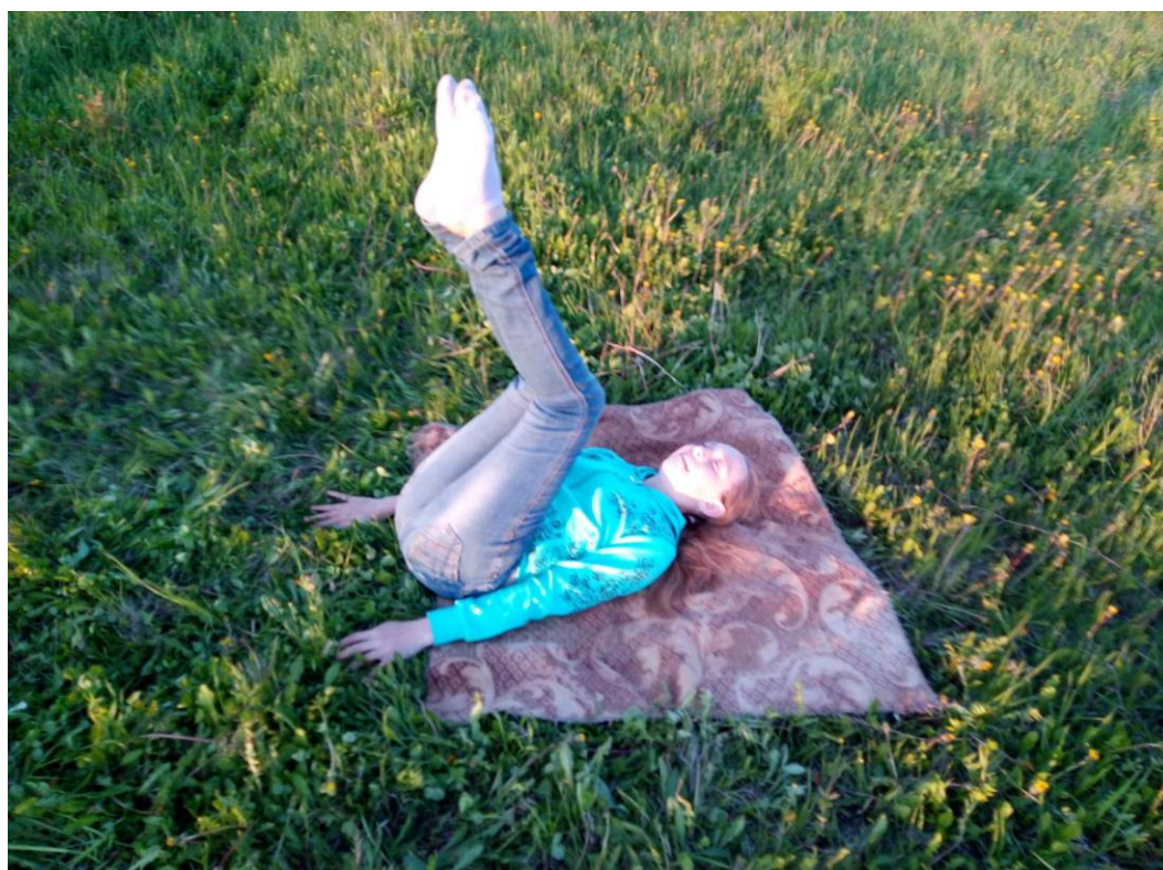
Упражнения для мышц таза