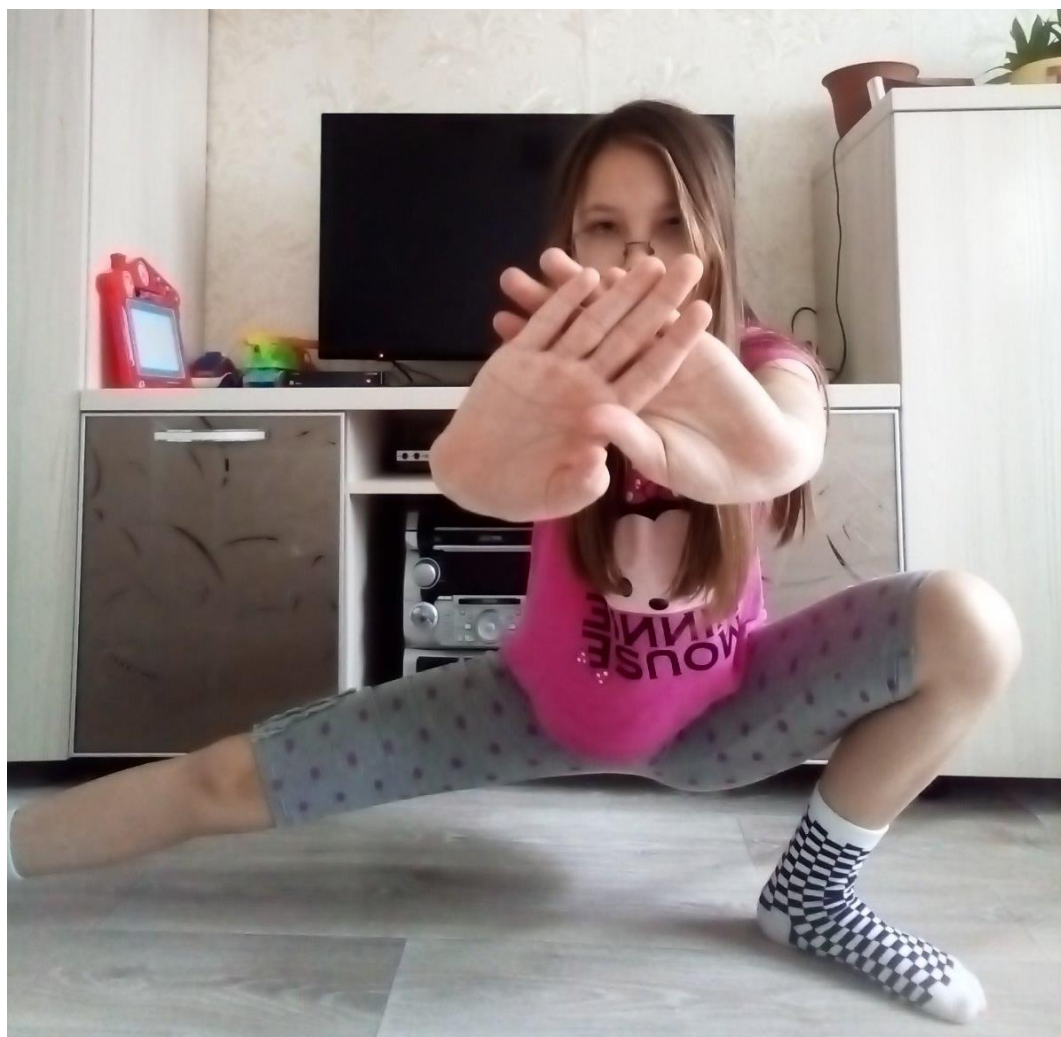
Упражнения для мышц бедра