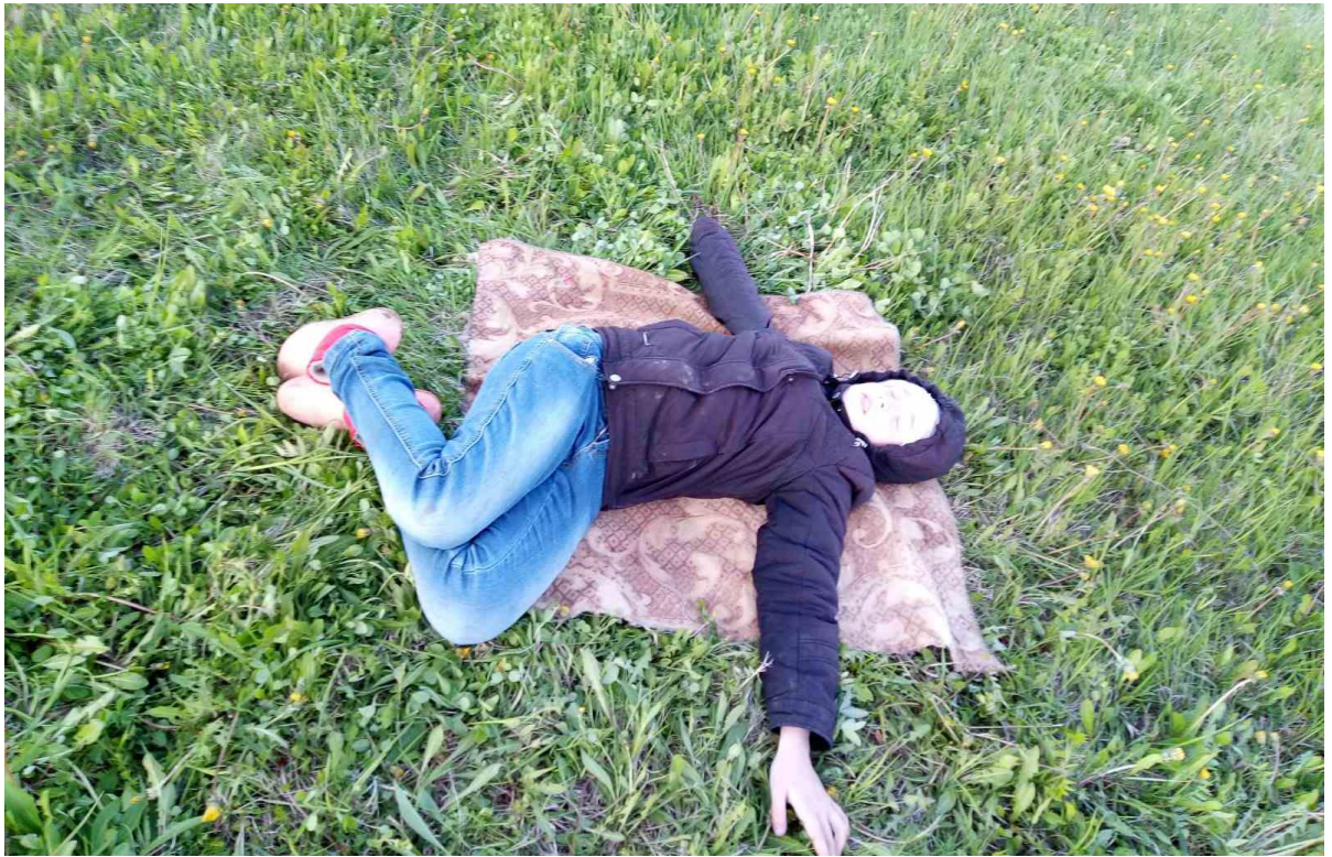
Упражнения для мышц брюшного пресса