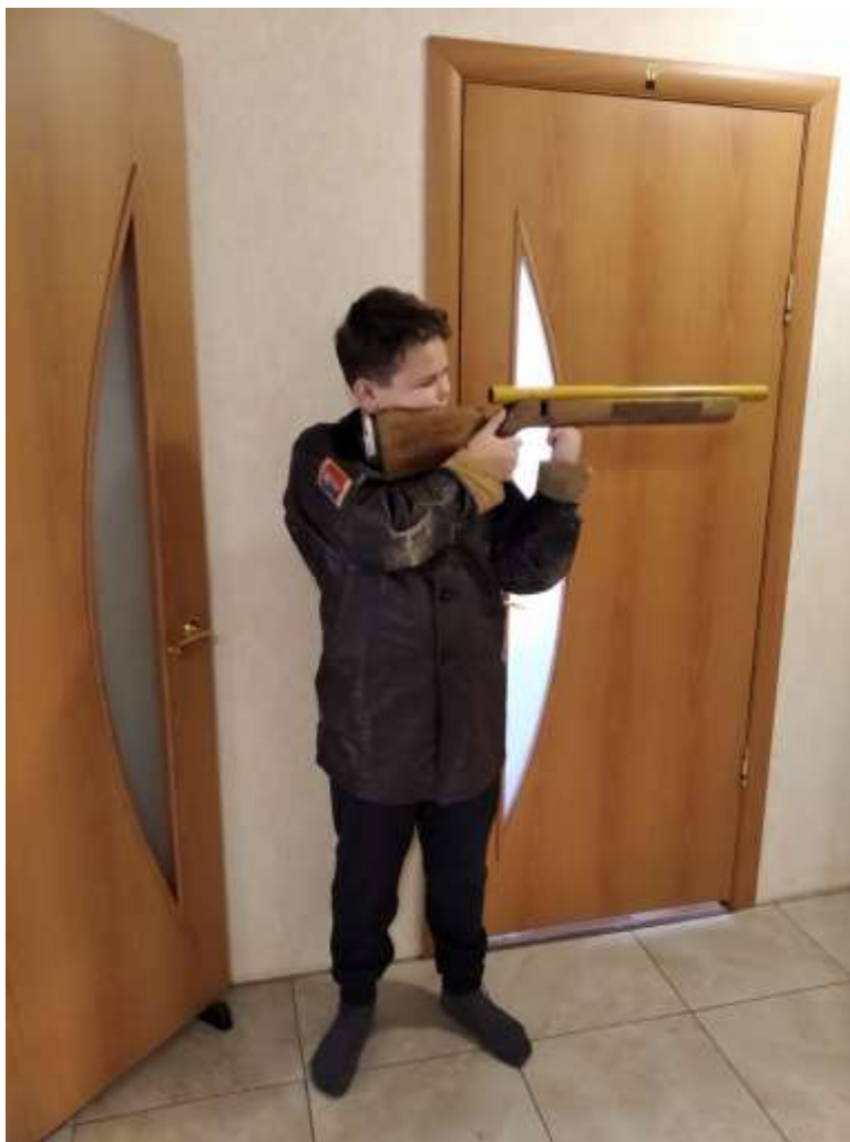
Отработка положения «стоя» с увеличением нагрузки