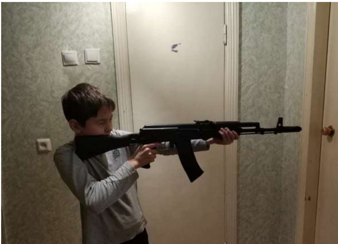
Отработка положения «стоя» с увеличением нагрузки