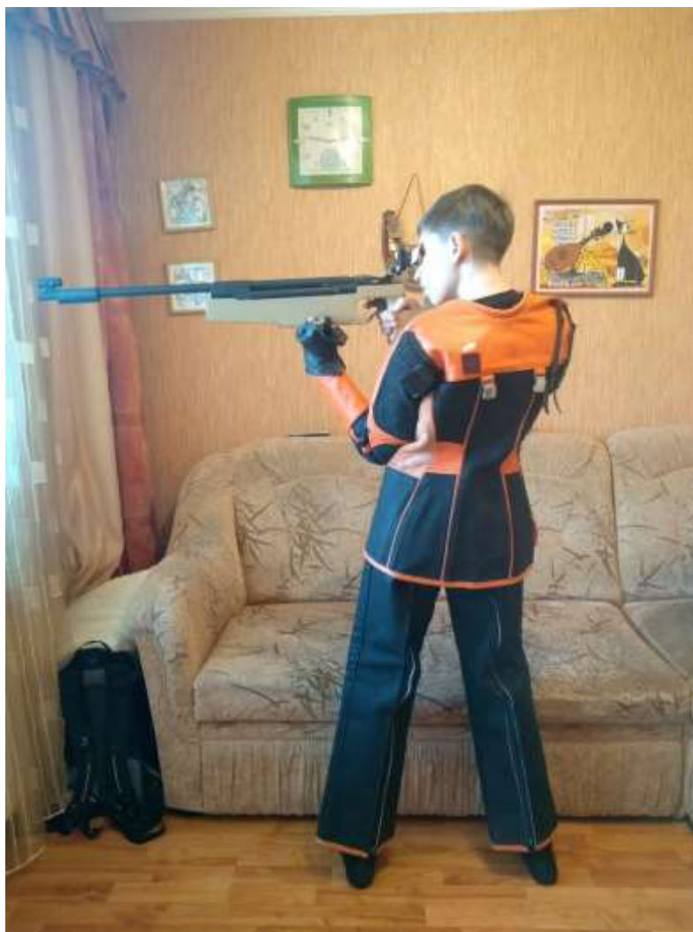
Отработка положения «стоя» с увеличением нагрузки