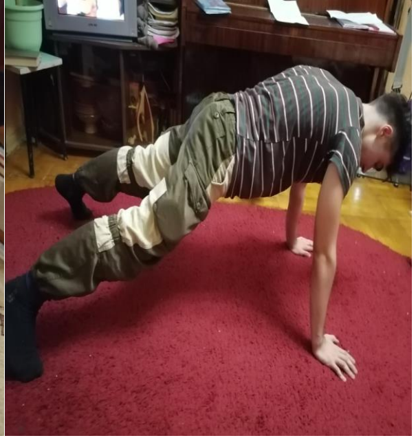
- боковая стойка (и перемещения в ней)