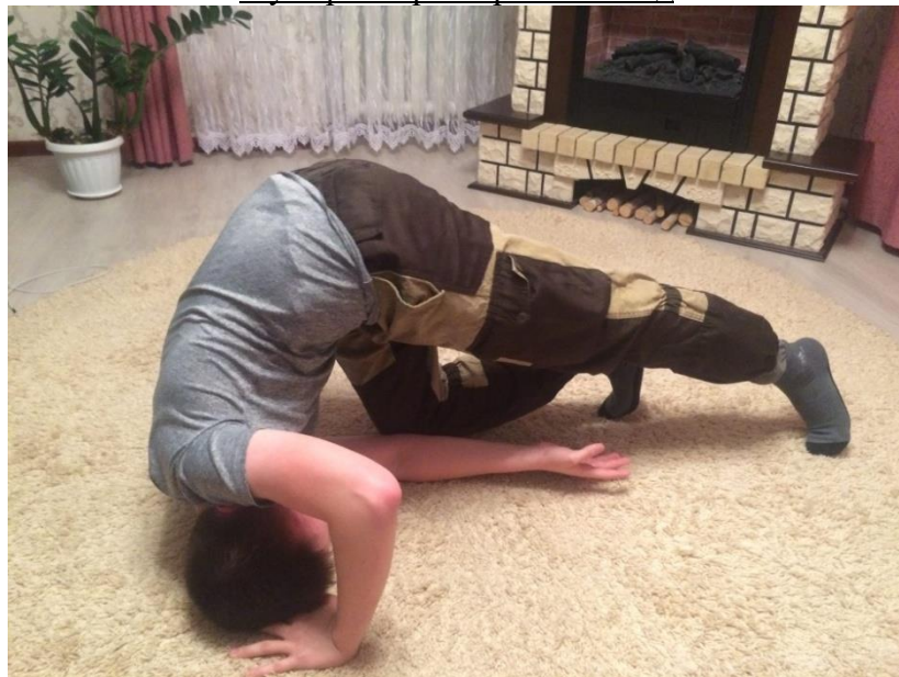
- кувyрок по диагонали