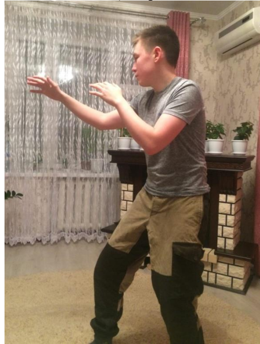
- упражнение «крокодил»