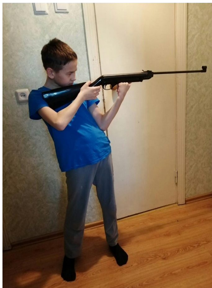
Стоим, удерживаем оружие