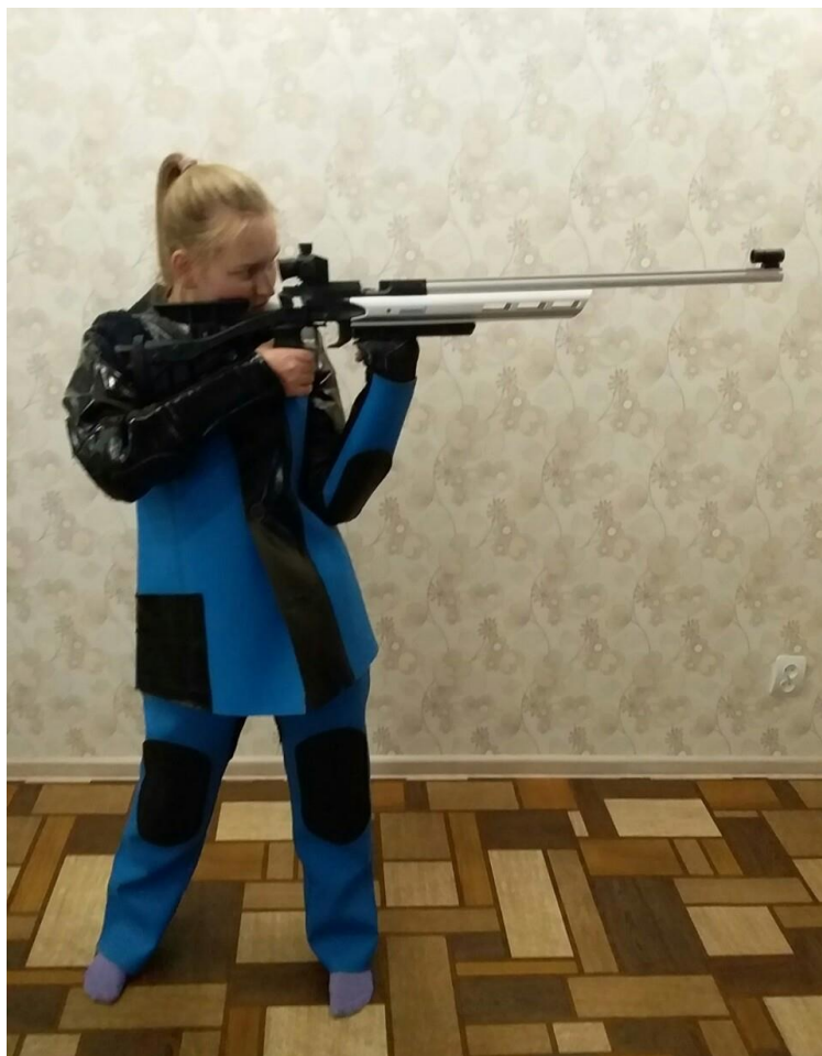
Стоим в обычной позе на удержание оружия