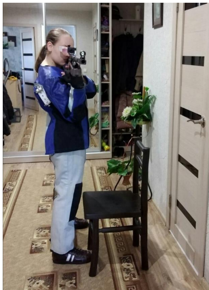
Выполняем это же упражнение