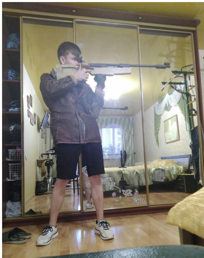
Стоим, удерживаем оружие