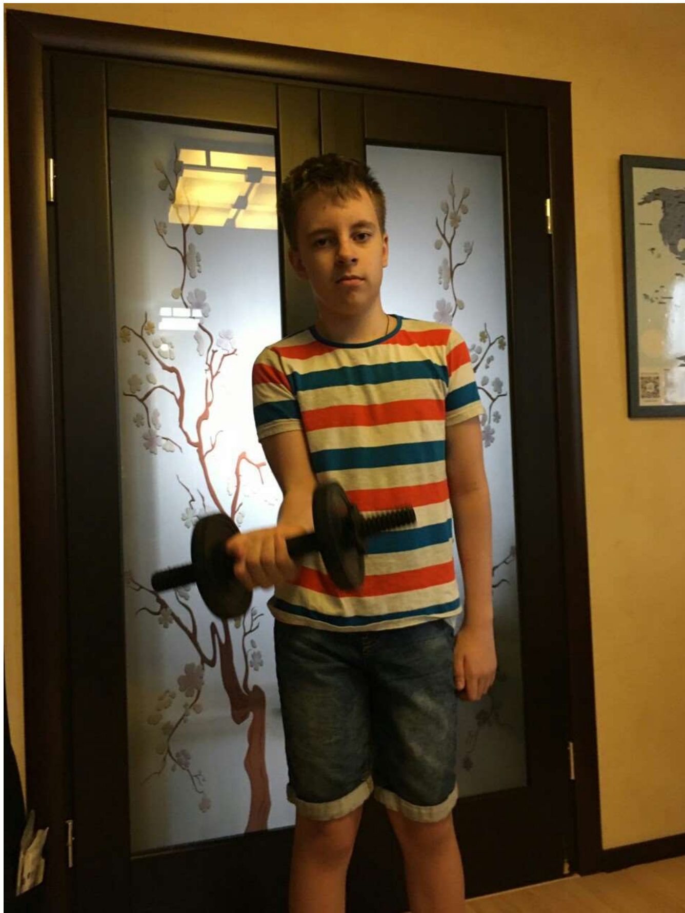
Упражнение с гантелью