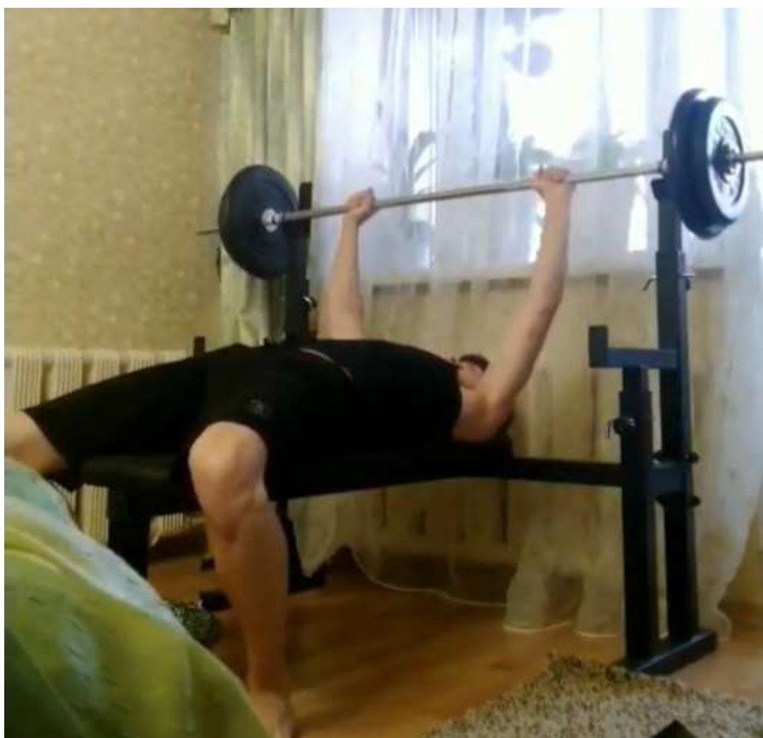
Упражнение со штангой