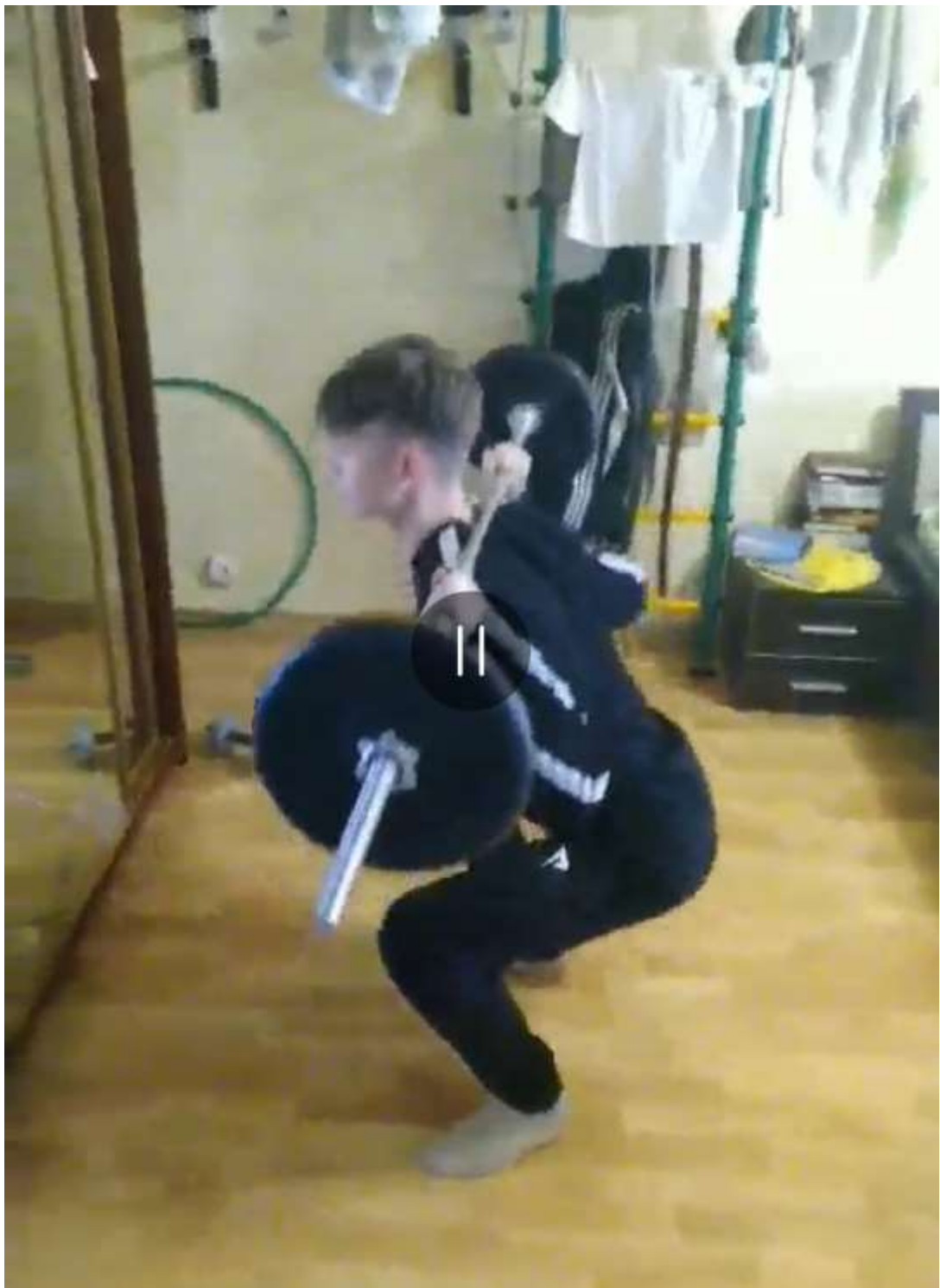
Упражнение со штангой