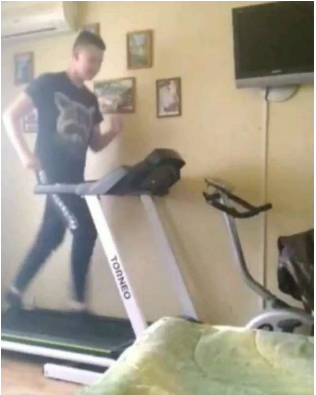
Бег на тренажере