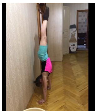
3. Стойка на руках