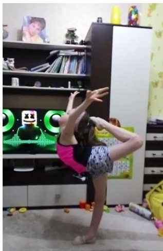
5. Кольцо без помощи