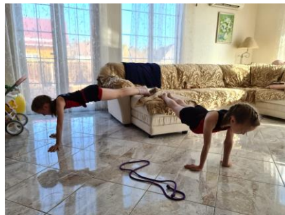
6. «Стол» - планка с ногами на опоре