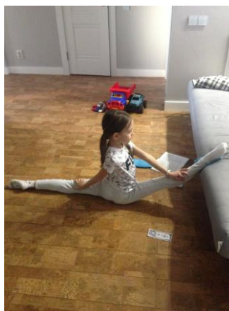
4. Шпагат на правую ногу с опоры