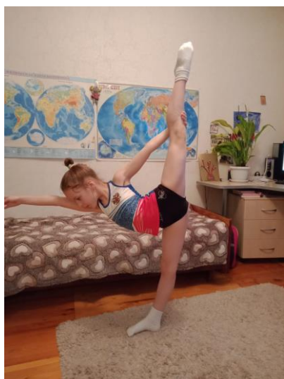
8. «Уточка» левой на стопе