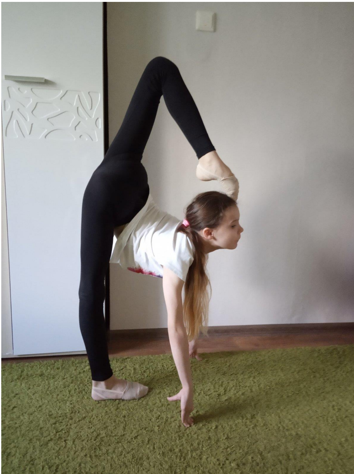
Равновесие в кольцо