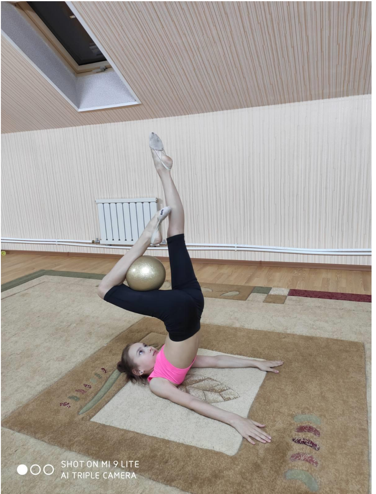
Мастерство с мячом