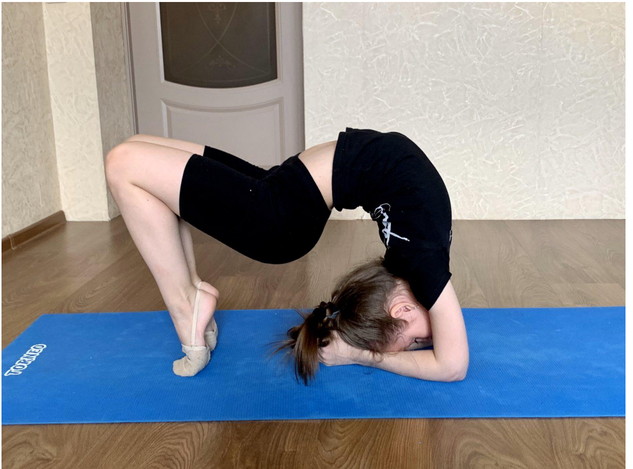
Упражнение на гибкость