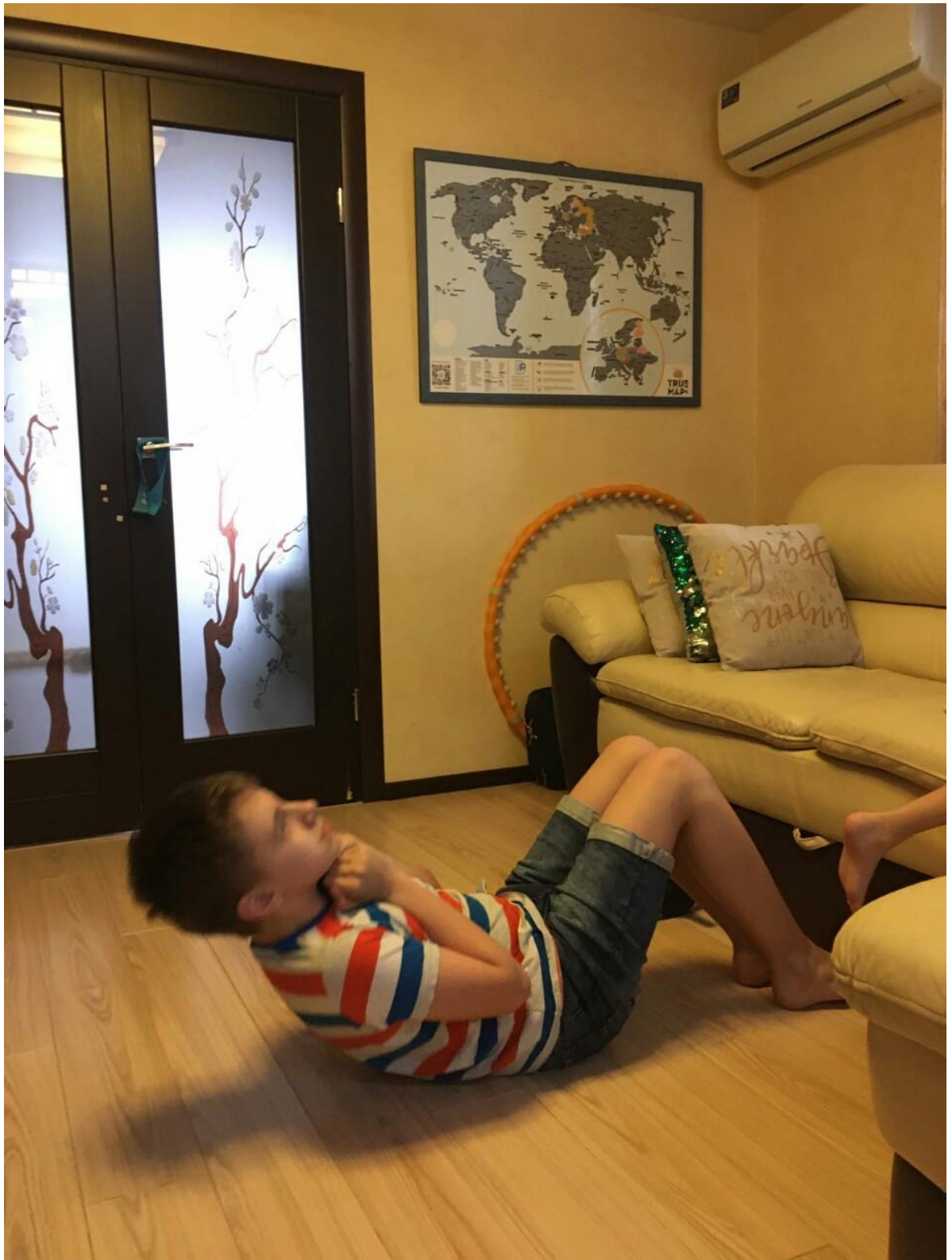
Упражнения на пресс