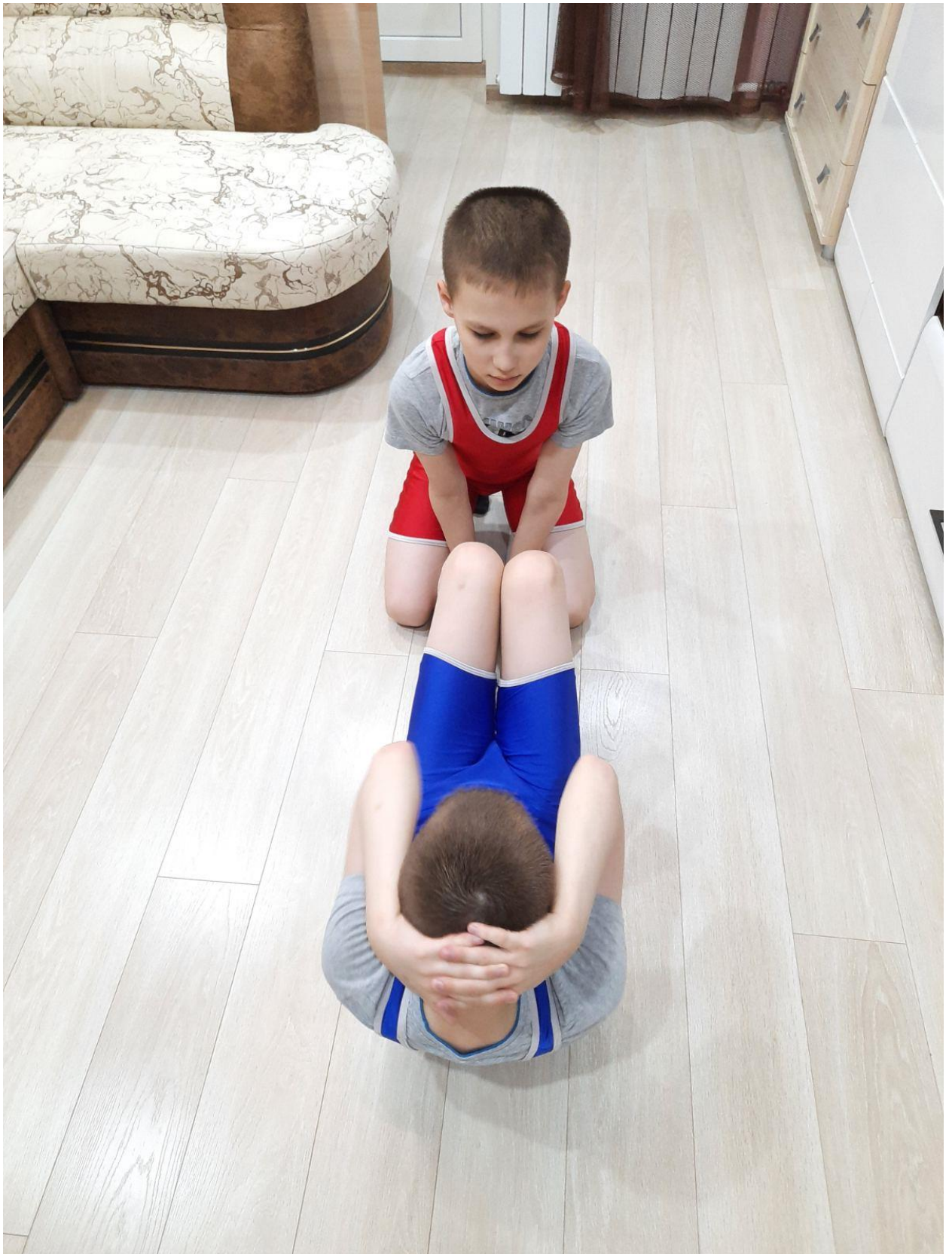
Подъем туловища из положения лежа на спине