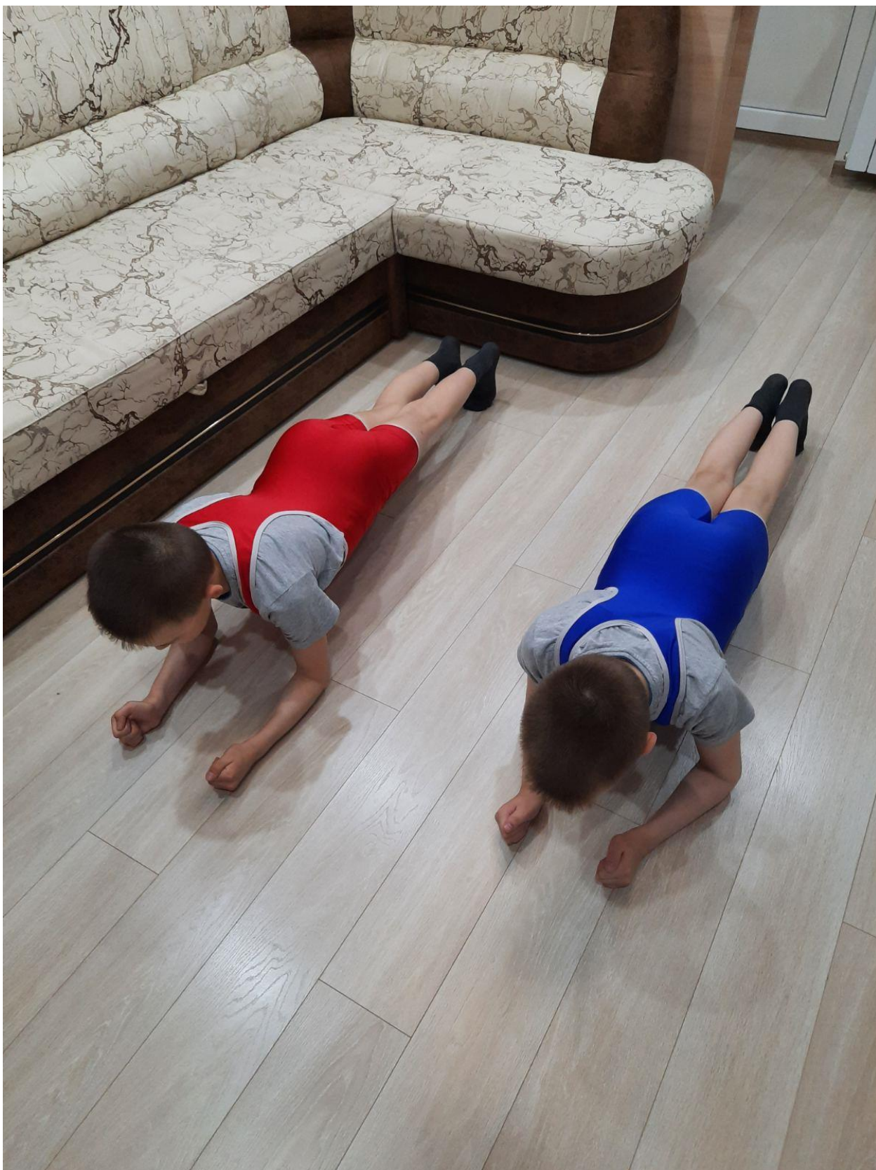
"Планка" в упоре на локтях