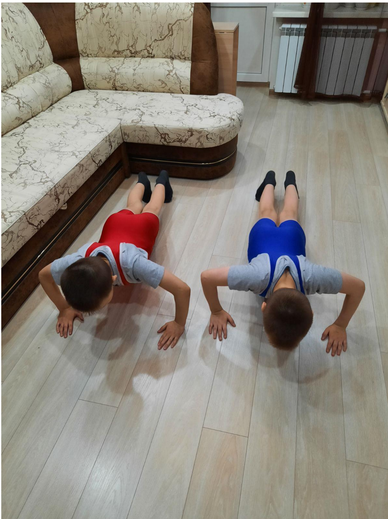
отжимание от пола в упоре лежа