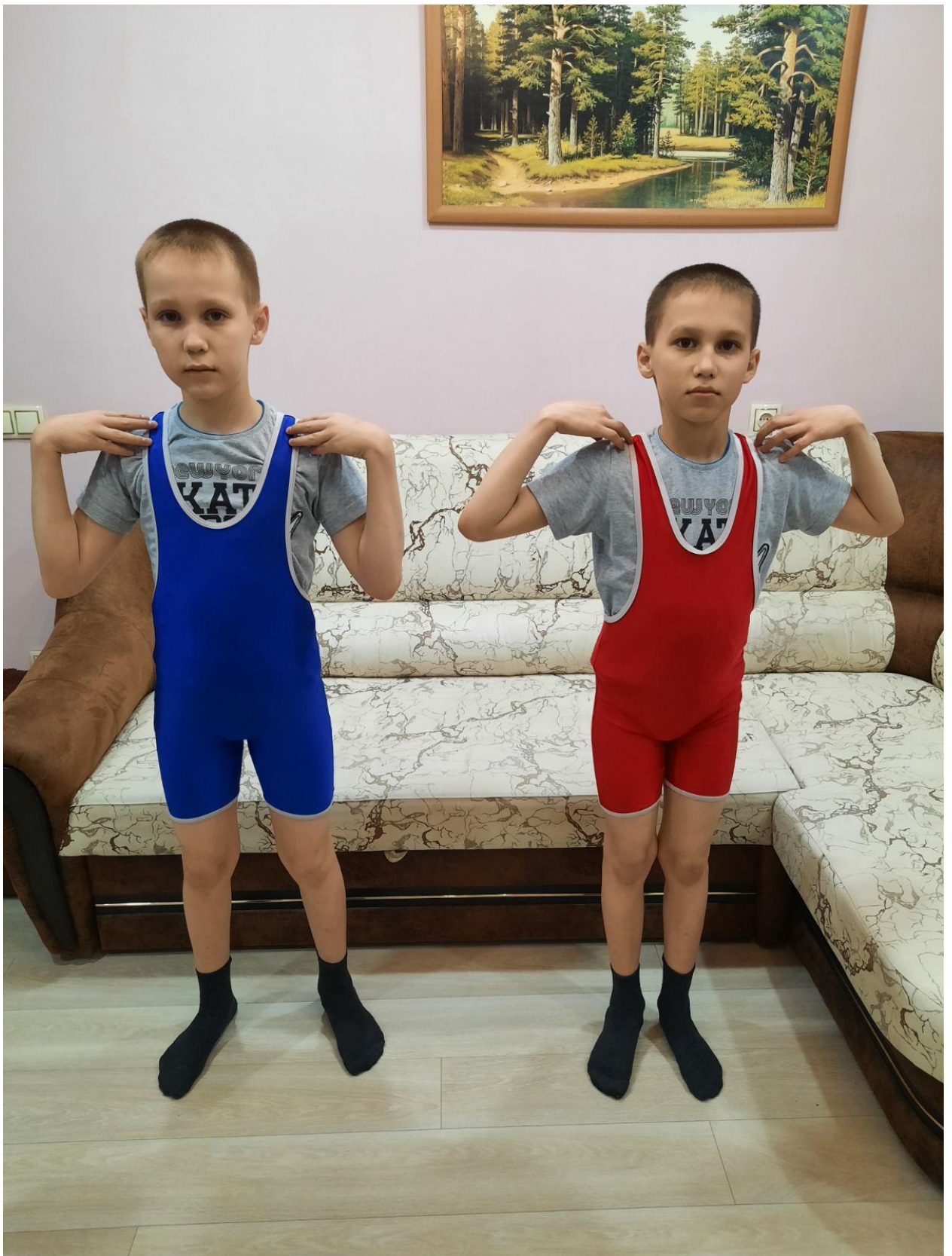
Общеразвивающее упражнение на плечи