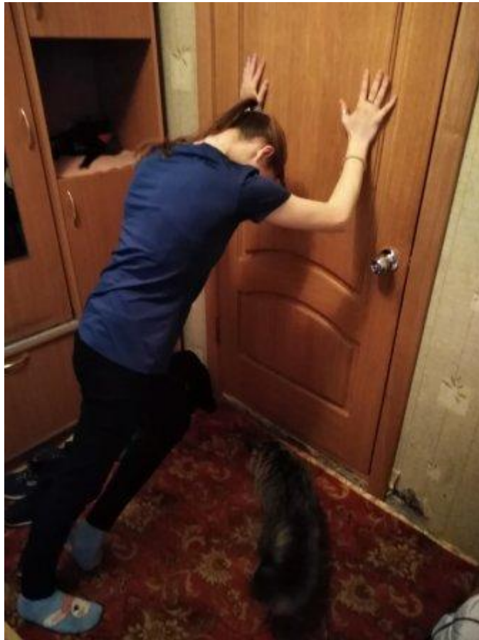
Упражнение на развитие силы