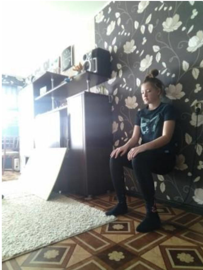
Упражнение для мышц ног