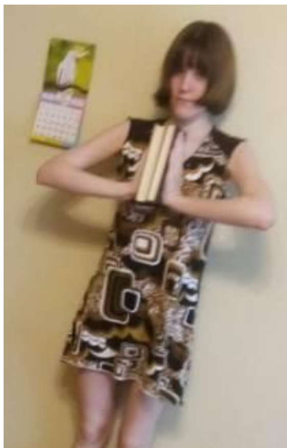
Упражнение на мышцы рук