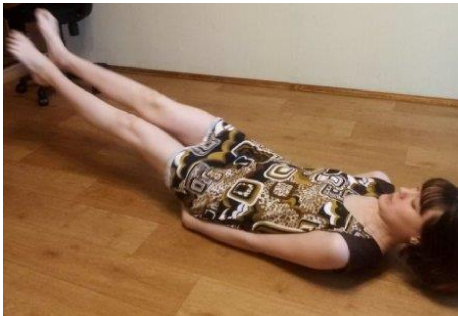
Упражнение для мышц брюшного пресса