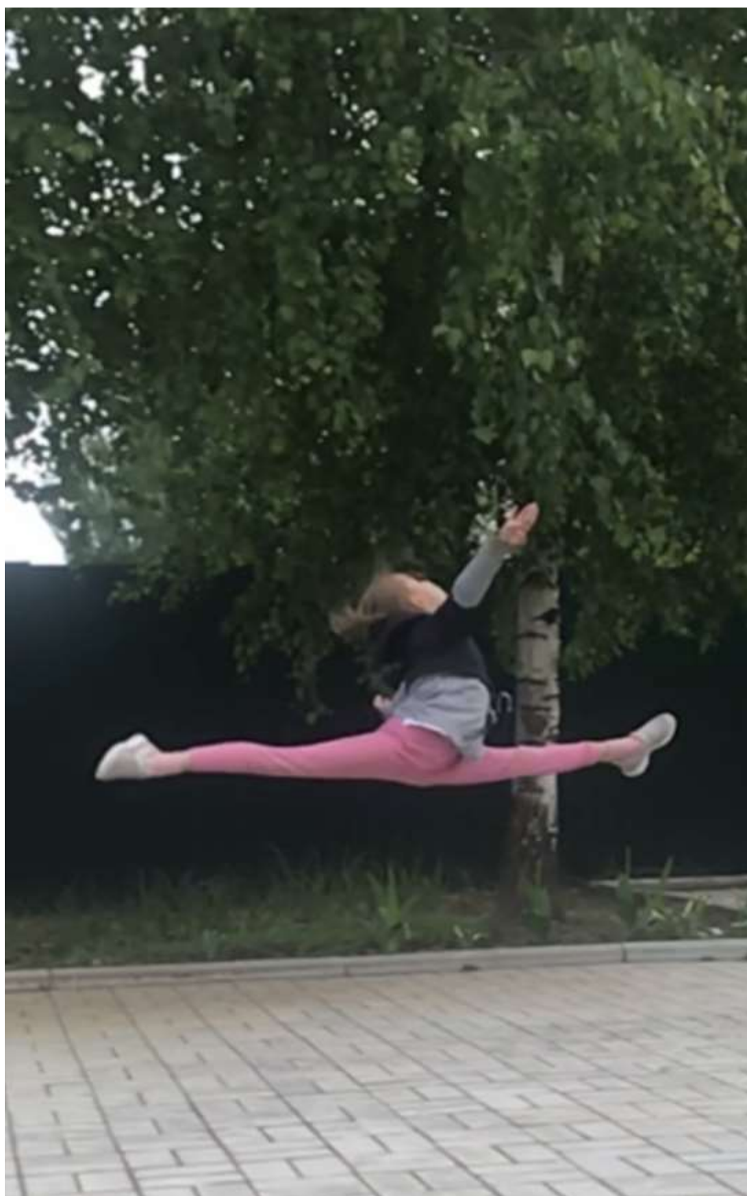
Прыжок в шпагат на левую ногу.