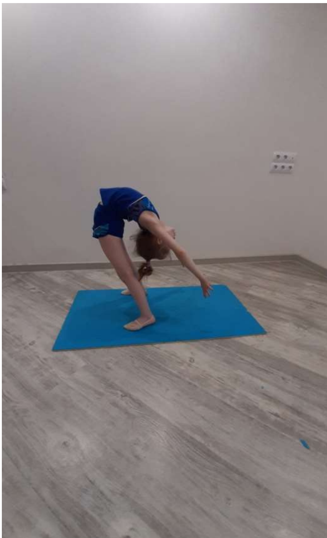
Наклон назад стоя.