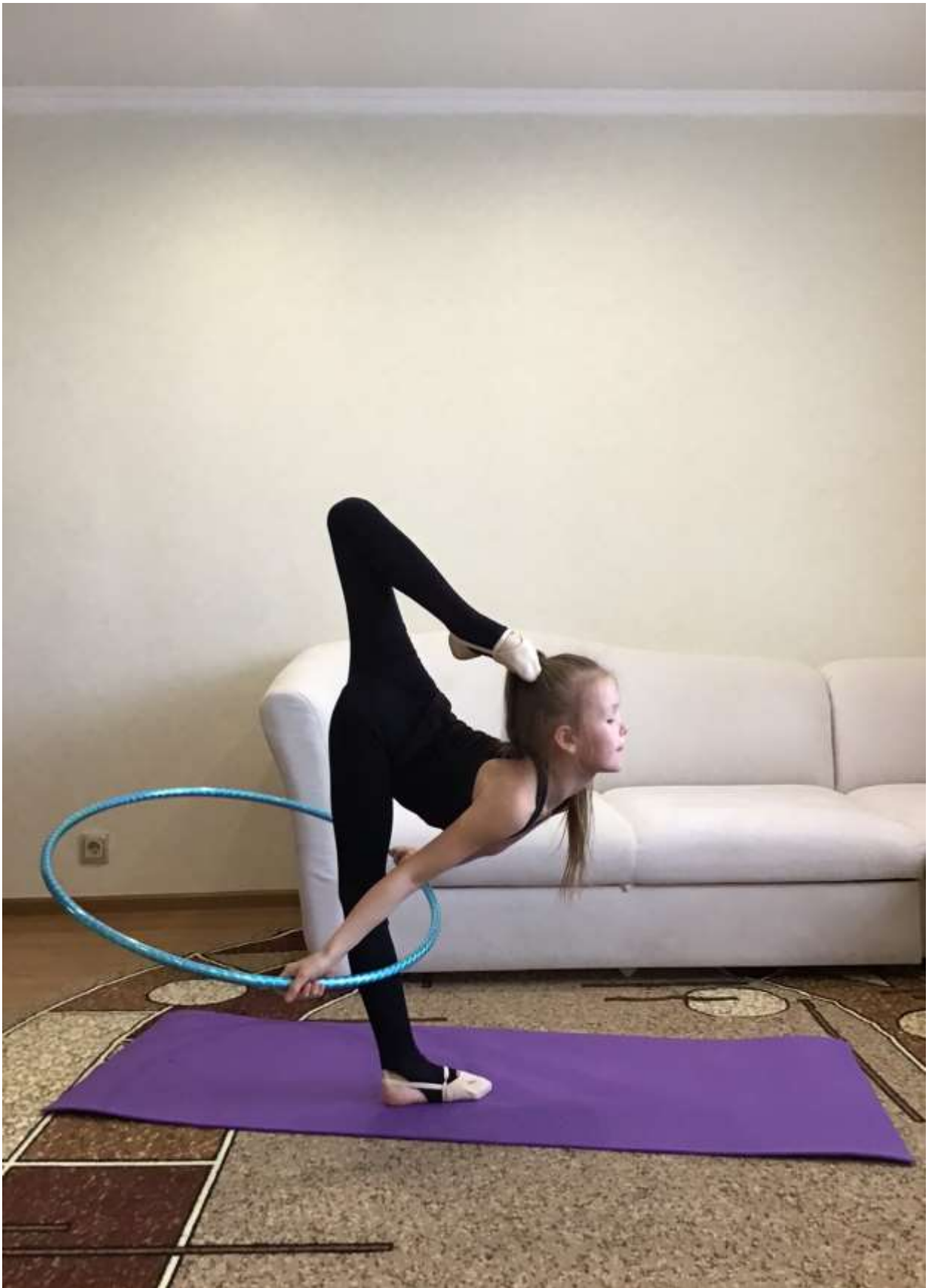
Равновесие в кольцо с обручем.